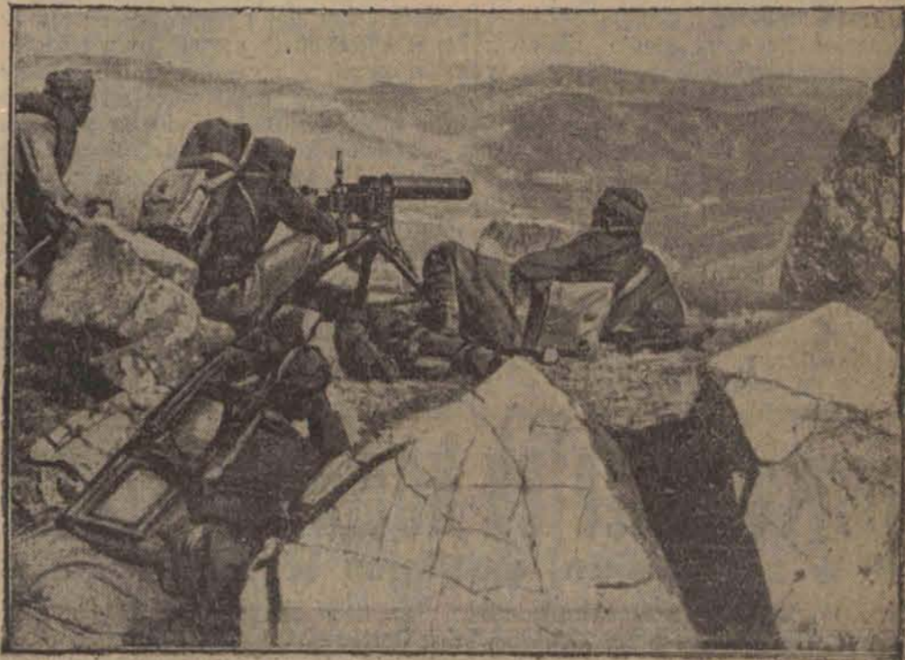
Wysiłki wojskowe Włoch koncentrują się obecnie jak wiadomo w Afryce. Aby jednak udowodnić Europie, że siły włoskie nie są osłabione przez operacje afrykańskie, Mussolini urządził manewry kilku Korpusów w Alpach.