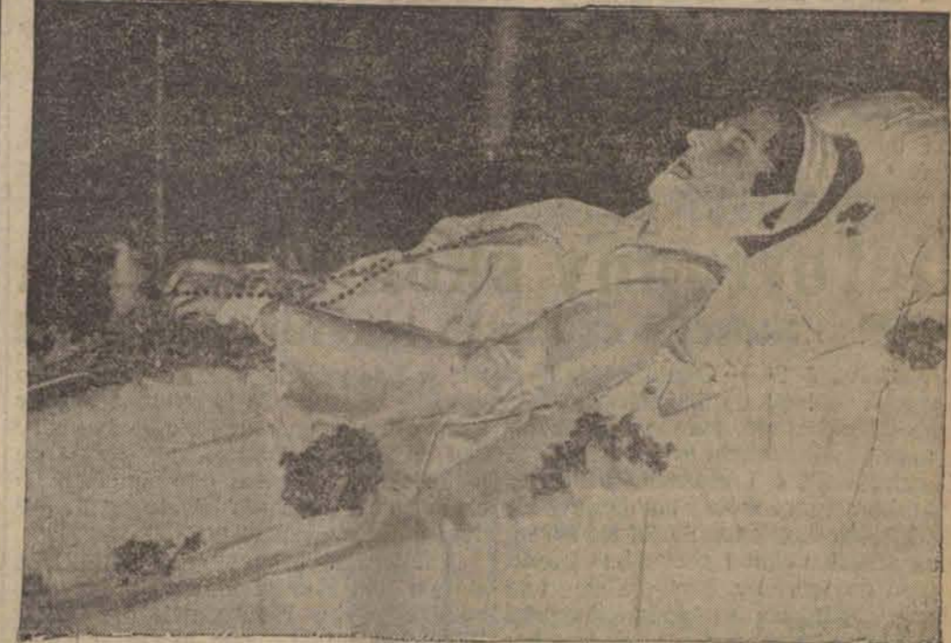
Wskutek odniesionych ran głowy prawa strona twarzy zmarłej królowej Belgii ukryta jest bandażem.