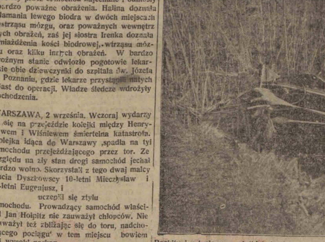
Rozbity i zatopiony w płytkiej, trzęsącej wodzie obok króla Leopolda III.