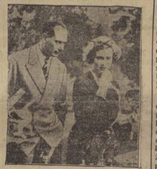
Książę Gloucester zareczył się z lady Alicją Montagu - Douglas - Scott, córką księcia Buccleuch.