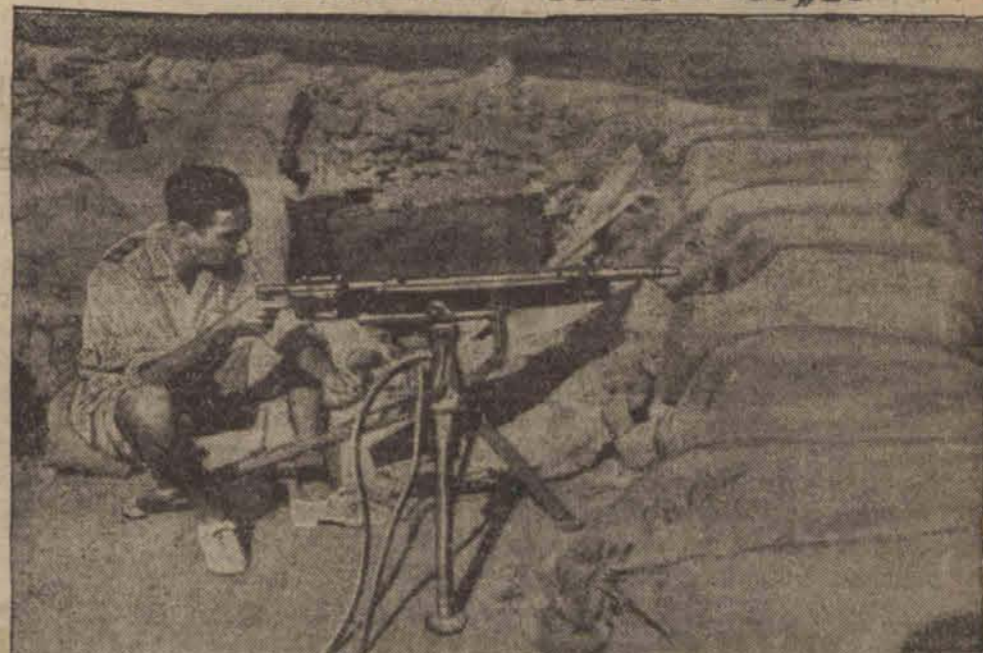
Włoski oficer przy karabinie maszynowym na granicy Abisynji. O upale świadczą krótkie spodnie i sandały oficera i koszuła z naszytymi oznakami stopnia.