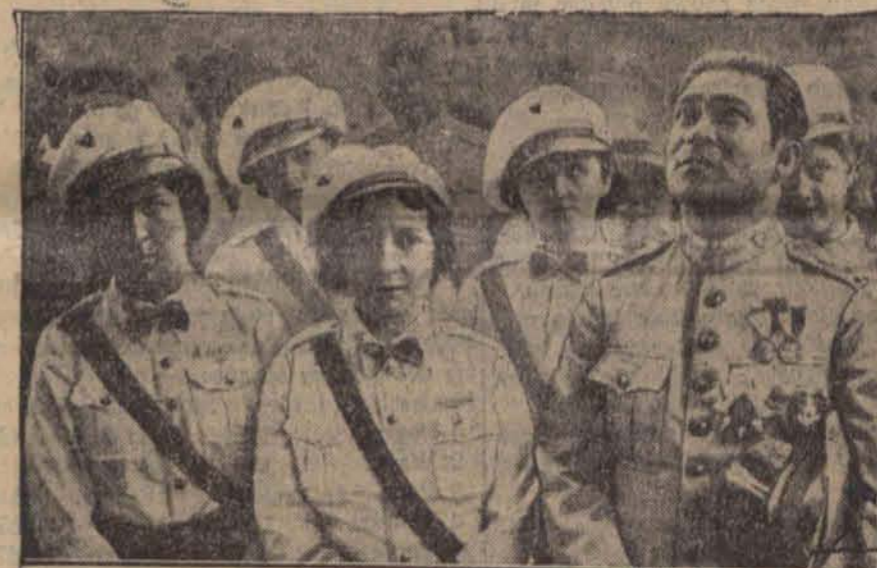
Dyktaorka Kuby (na prawo) pułkownik Battista w otoczeniu oficerów utworzonej dla obrony...