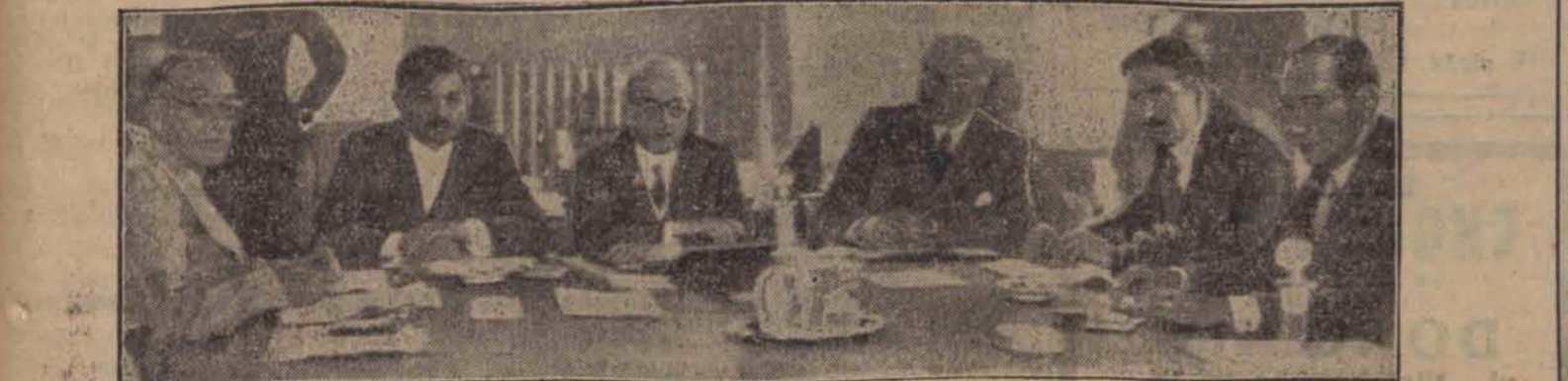
Trudny orzech do zgryzienia ma obecnie „Komitet pięciu” Ligi Narodów, którego propozycje Mussołini stanowczo odrzucił.