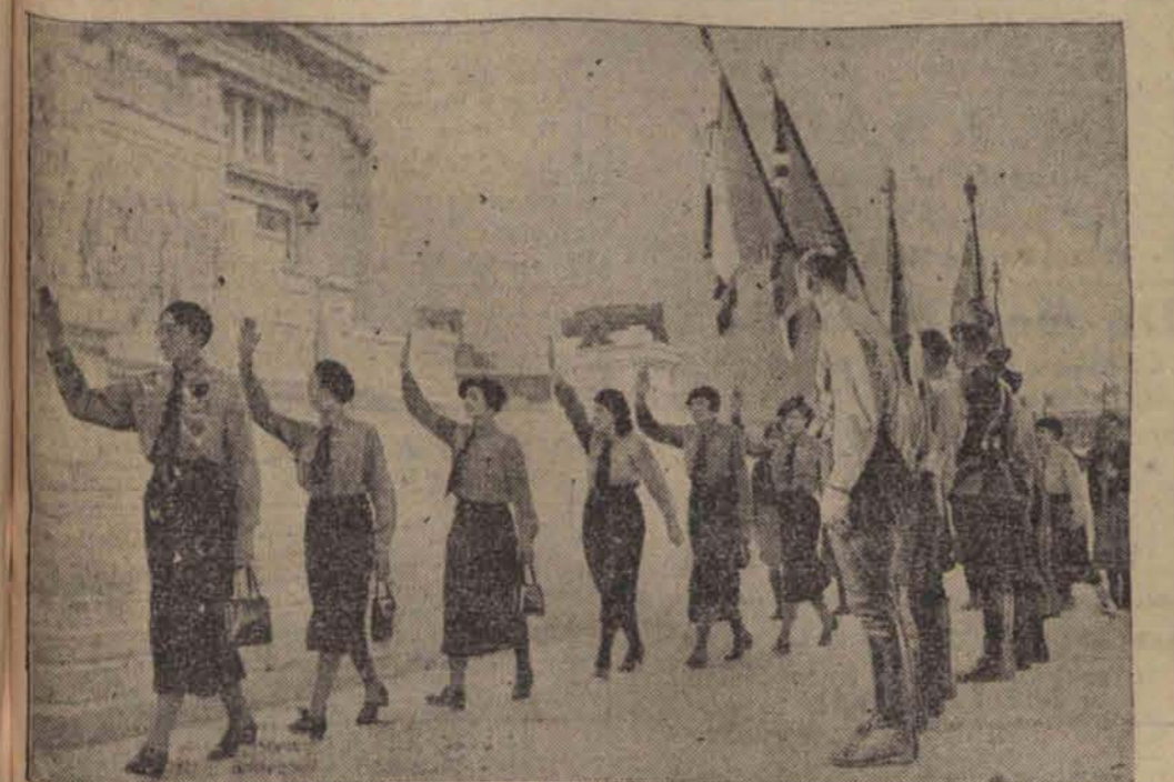
Delegacje francuskich organizacji faszystowskich defilują przed włoskim „Ojczyznem” w Rzymie