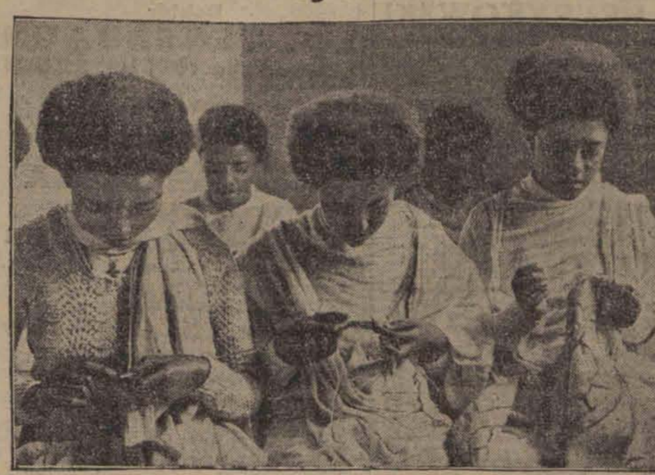
Młode Abisynki podczas godziny robót ręcznych w liceum w Addis Abeba.