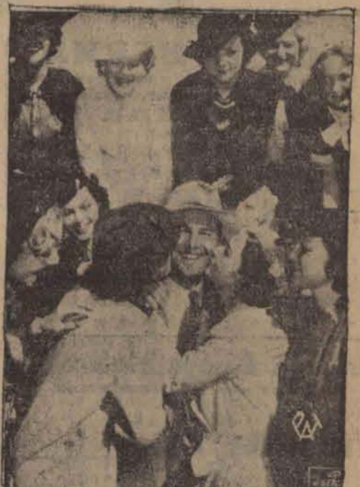
W tych dniach przybył do Hollywood znakomity nasz śpiewak Jan Kiepura. Zdjęcie nasze przedstawia powitanie artysty polskiego w wytwórni filmowej przez grupę uroczych tancerek.