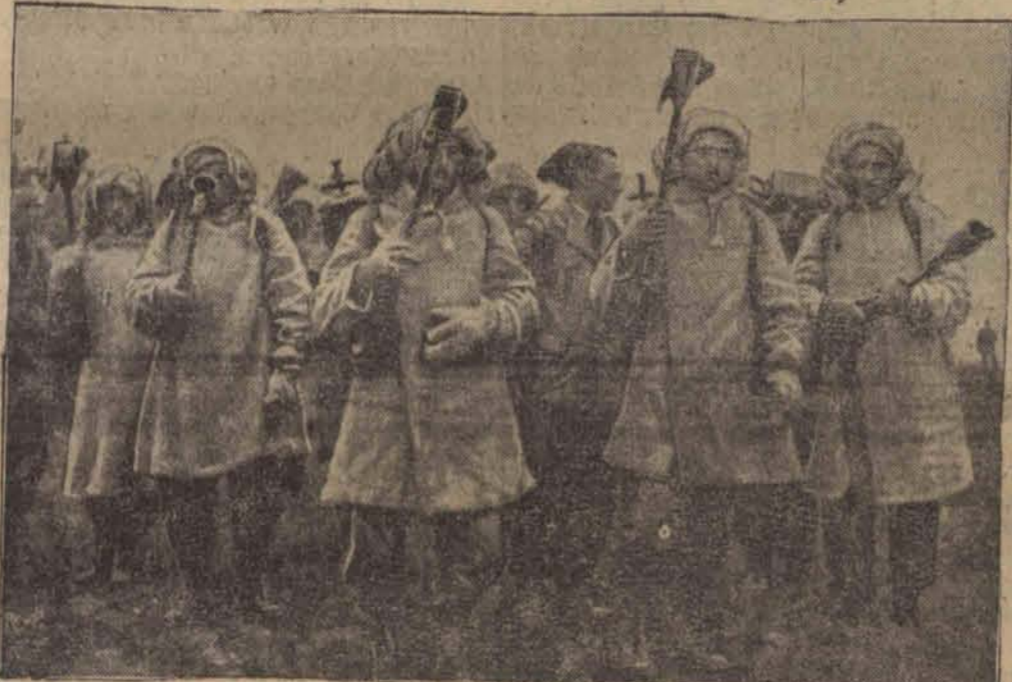
Włoskie wojska zaopatrzone w miotacze płomieni i azbestowe niepalne mundury ochronne.

wierzyły w skuteczność zarządzeń Ligi, to prawdopodobnie w najbliższej przyszłości zgodziłyby się na zawarcie pokoju.