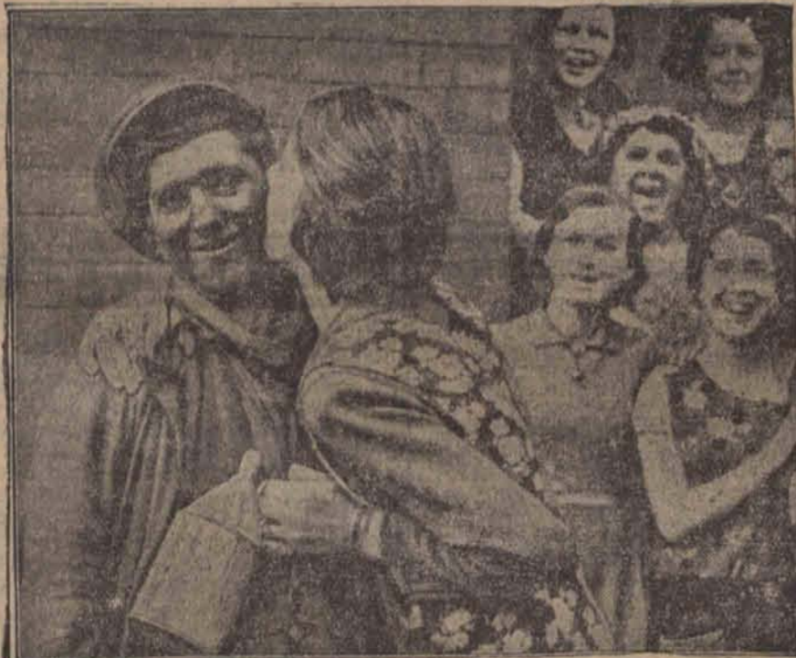
Zona strajkującego górnik angielskiego w Monouthshire wita męża, który po 120 godzinach powrócił na powierzchnię z okupowanej kopalni.