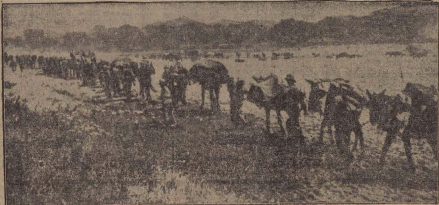
Kolumna włoska maszeruje po bezwodnym płaskowyżu abisyńskim z prowiantem i wodą dla walczących oddziałów w temperaturze 50 stopni.