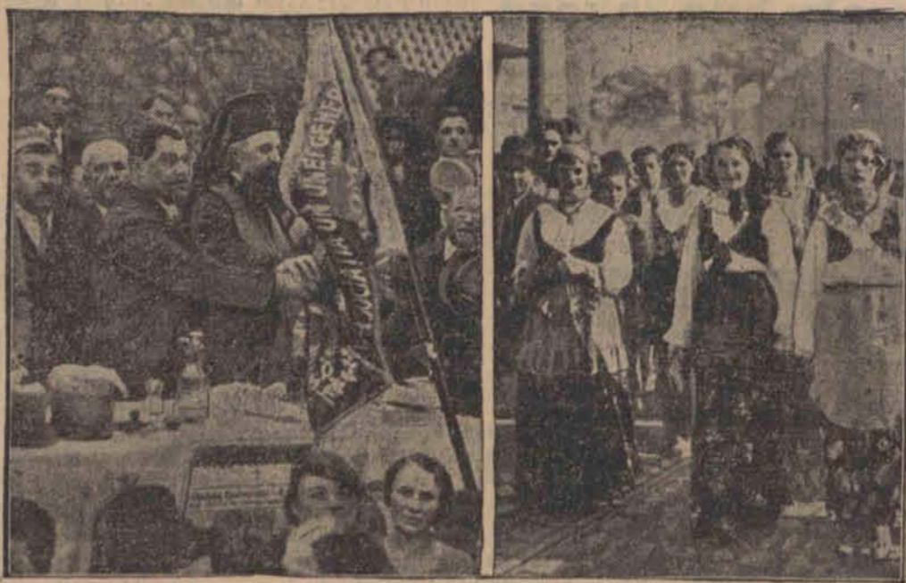
Związek Cyganów odbył w Bukareszcie swój pierwszy kongres. „Wojewoda” 100 tys. Cyganów rumuńskich (po lewej stronie archimandryty) otrzymał nową chorągiew związku. Po prawej stronie: Cyganki w pochodzie na ulicach Bukaresztu.