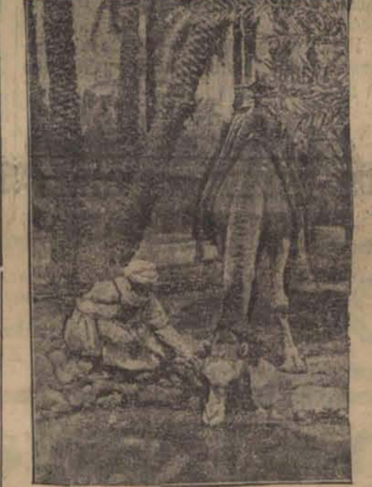
Włoski meharysta poi swego wielbłąda w oazie. Część tych „kawalerzystów” pustyni Włosi przeczucili do Somali.

Cyły impet włoskiego szturmu kieruje się za Makalle.