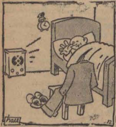
— Teraz wszyscy staną na baczność i wykonają kilka przysiadów.