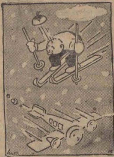
Udało mi się!