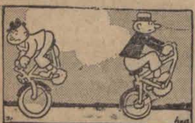
dwóch jeźdźców na tandemie.