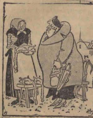
— Ta gęś jest bardzo chuda. — Nie wszystkie mogą być podobne do pani.