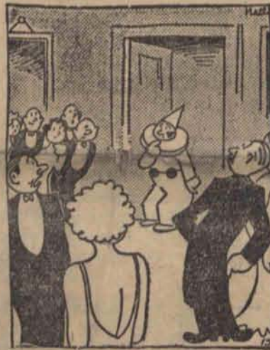
— Przepraszam, myślałam, że mnie zaproszono na bal maskowy.