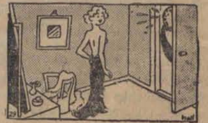
— Może pan zaczeka chwilę, jestem nieubrana.