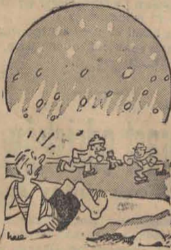
— To już zima, a ja jeszcze jestem bez tyżew.