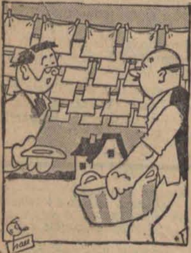
— Przepraszam pana, czy pan nie mógł by mnie poinformować, gdzie mieszkają słynne pieluszki?