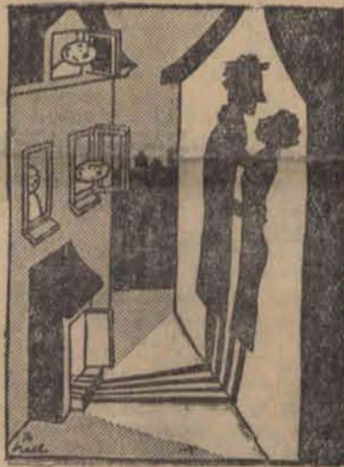
Żywy obraz na murze