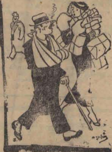
— Kiedy wybieram się ze znajomą do sklepu, zawiązuję ręką na temblaku.