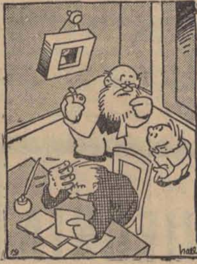
— Dziadziu, pomóż memu tatusiowi rozwiązać moje zadanie.