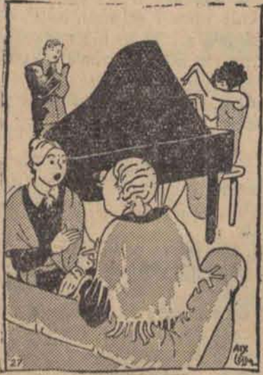
— Moja córka jest zakochana w Szope nie — A ja myślałam, że ona jest zaręczona z panem Głębkiem!