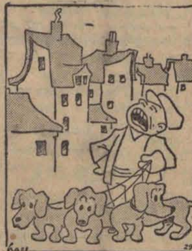
— Jamniki na sprzedaż jamniki, po 5 zł. za metr.