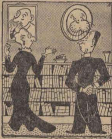
— Ta głowa morsa harmonizuje doskonale z obrazem wuja Apolinarego.