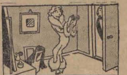
A teraz jestem ubrana.