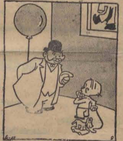
— Zgadnij co ci wujaszek przyniósł z miasta.