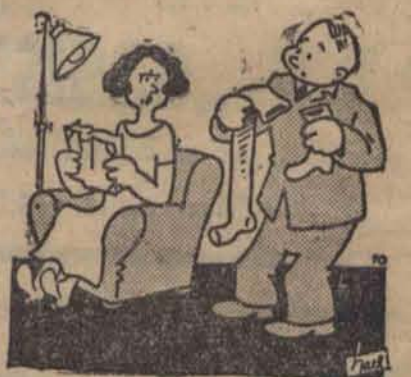
— Tę pończochę zrobiłam na pamiątkę twojej eskapady sylwestrowej.