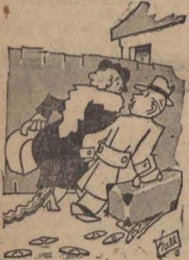
— Udawaj, jakby nigdy nie. Celnicy nie zauważą!