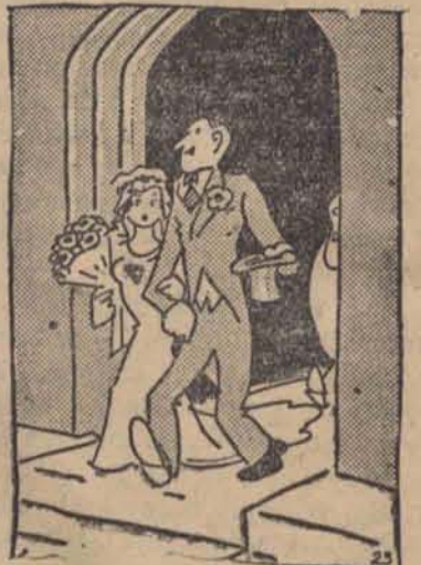
— Jakże tęsknię do naszego gniazdka. — Czy ciebie też uciskają twoje buty?