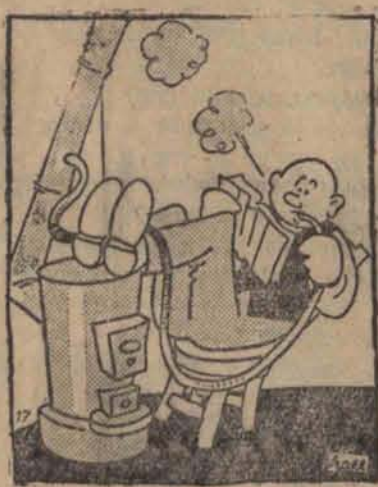
Podwójnie wykorzystany dymek.