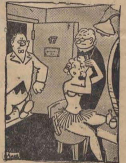
— Przepraszam, że pozwoliłam panu czekać, ale nie byłam jeszcze ubrana.