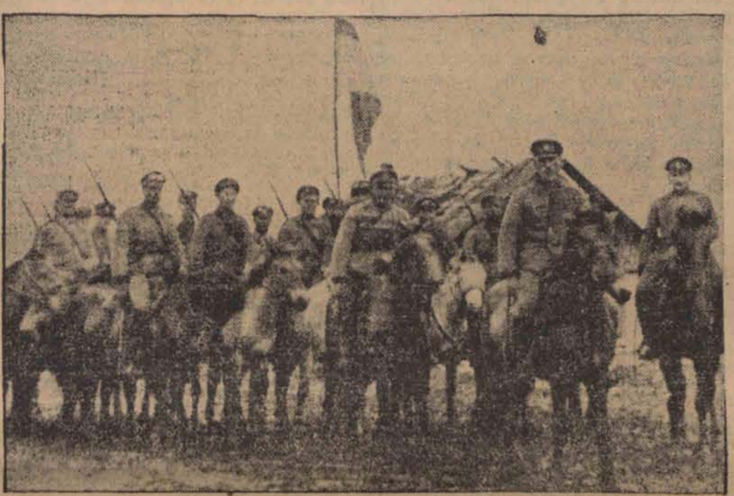
Oddział białych wojsk rosyjskich które służą w armii mandzurskiej na pograniczu sowieckim.