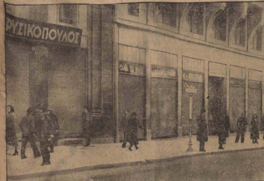
Na znak protestu przeciwko wysokim podatkom kupecy w Atenach zamknęli swoje sklepy.

Kupiony znaczek F.O.M. tworzy miliony — potrzebne na budowę polskich okrętów wojennych!