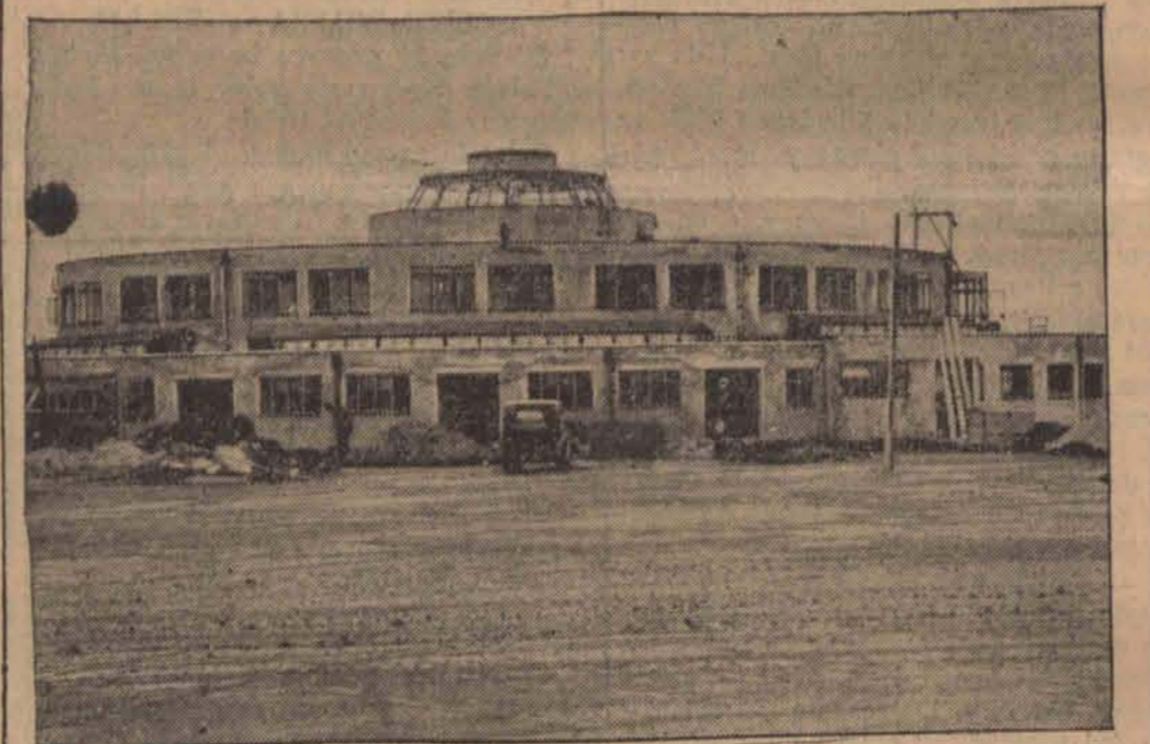
Gmach centralny nowego lotniska londyńskiego w Gatwick przed wykończeniem.