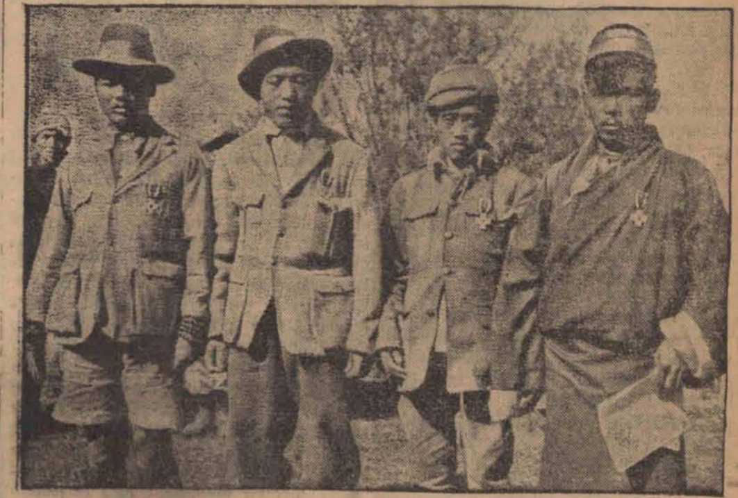
Czterej tragarze tybetańscy odznaczeni medalami Czerwonego Krzyża za uratowanie ekspedycji wysokogórskiej w Himalajach.