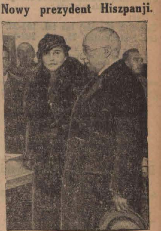
Nowoobрани prezydent Hiszpanji Azana z małżonką Azana otrzymał 754 głosy na 846 głoszących.

ATENY 11,5. Po posiedzeniu rady ministrów Metaxas oświadczył przedstawicielom prasy, iż wydane zostały jaknajsurowsze zarządzenia w celu utrzymania porządku. W ciągu dnia dzisiejszego są zabronione zarówno w stolicy, jak i na prowincji, wszelkiego rodzaju zgromadzenia. Premier Metaxas wyraził ubolewanie, iż ogłoszony strajk generalny w tak trudnej dla kraju chwili i że robotnicy odrzucili propozycje, które im uczyniono. Premier dodał, iż rękowania, mające na celu zakończenie konfliktu, są tem trudniejsze, iż trzeba je pro-