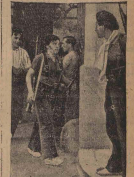
Uzbrojona członkini milicji w Madrycie.