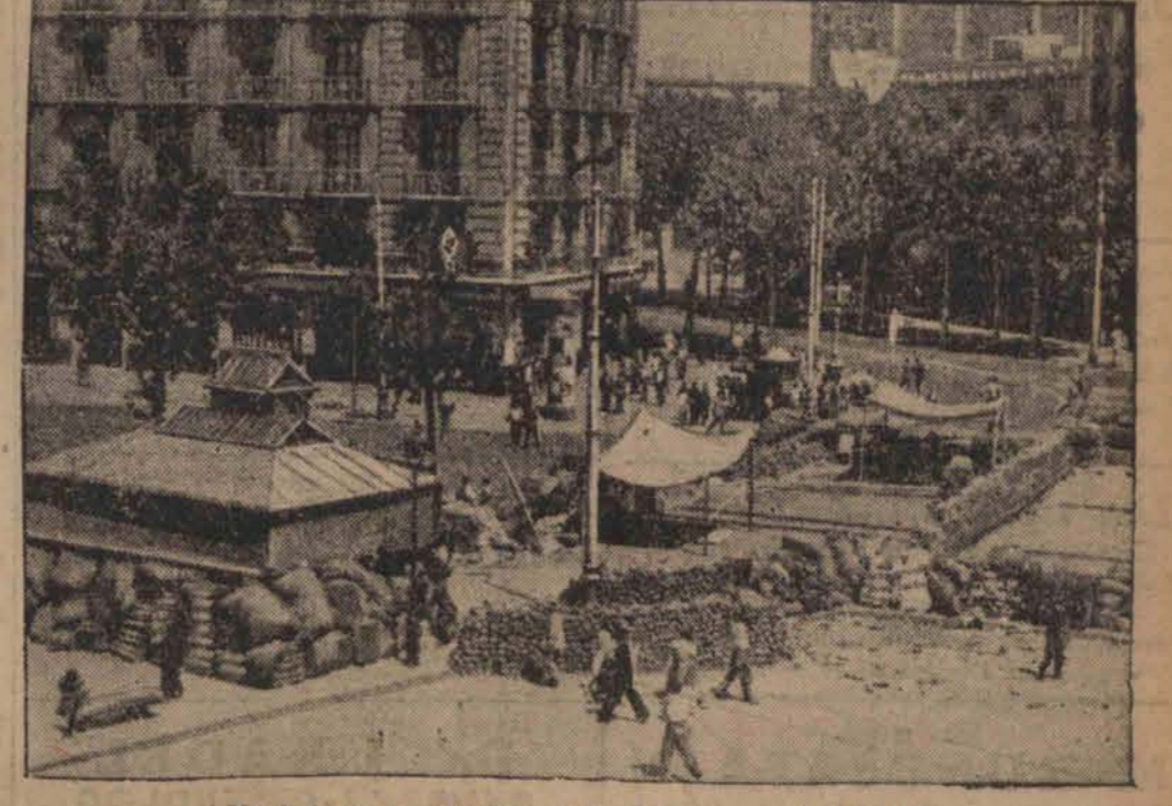
Na jednym z placów ustawiono liczne barykady.