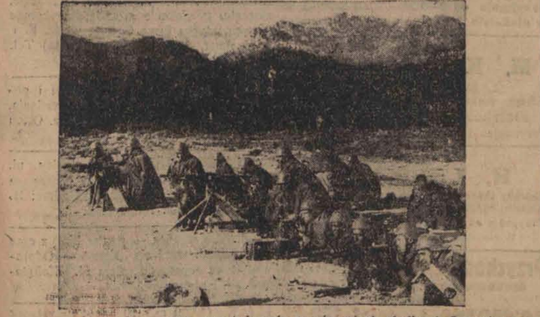
Wiosny wojsk powstańczych w górskich okolicach Samosierry.