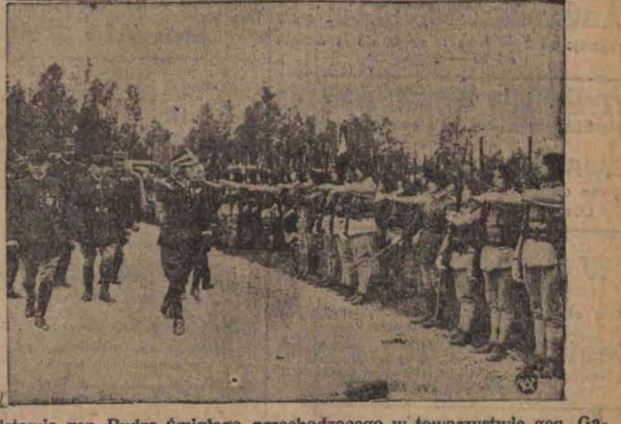
Zdjęcie przedstawia gen. Rydza-Śmigłego przechodzącego w towarzystwie gen. Gamelin przed oddziałem francuskich strzelców alpejskich.

Łódź, dnia 4 września. — W początkach roku bieżącego Zarząd Miejski na skutek inicjatywy Rady Przybocznej przy Tymczasowym Prezydencie m. Łodzi wystąpił do Zarządu K.E.L. o obniżkę taryfy tramwajowej. Akcja ta dała pewne rezultaty, mianowicie cena biletu normalnego została obniżona z 25 gr. na 22,5 gr., przy kupnie biletu na dwa przejazdy. Jednocześnie Zarząd Miejski zastrzegł się wówczas, że uważa tę obniżkę jedynie za tymczasową, i że po pewnym okresie próbnym domagać się będzie dalszej rewizji taryfy. Obecnie Zarząd Miejski wystosował do Zarządu K.E.L. list, w którym domaga się dalszej obniżki biletów tramwajowych wskazując przytem, iż dotychczasowa obniżka wpłynęła na wzrost frekwencji.