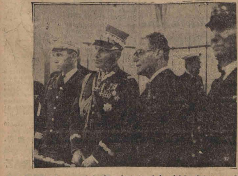
Gen. Rydz-Śmigły przygląda się w towarzystwie ministra Cota i gen. Gamelin rewii lotniczej w Chalons sur Marne.

ŁÓDŹ, 4.9. — W Łodzi trwa strajk pracowników warsztatów stolarskich i polerowniczych. Strajk ten obejmuje 3.000 osób. W związku ze strajkiem w dniu dzisiejszym w Inspektoracie Pracy odbędzie się wspólna konferencja, celem zlikwidowania zatargu.