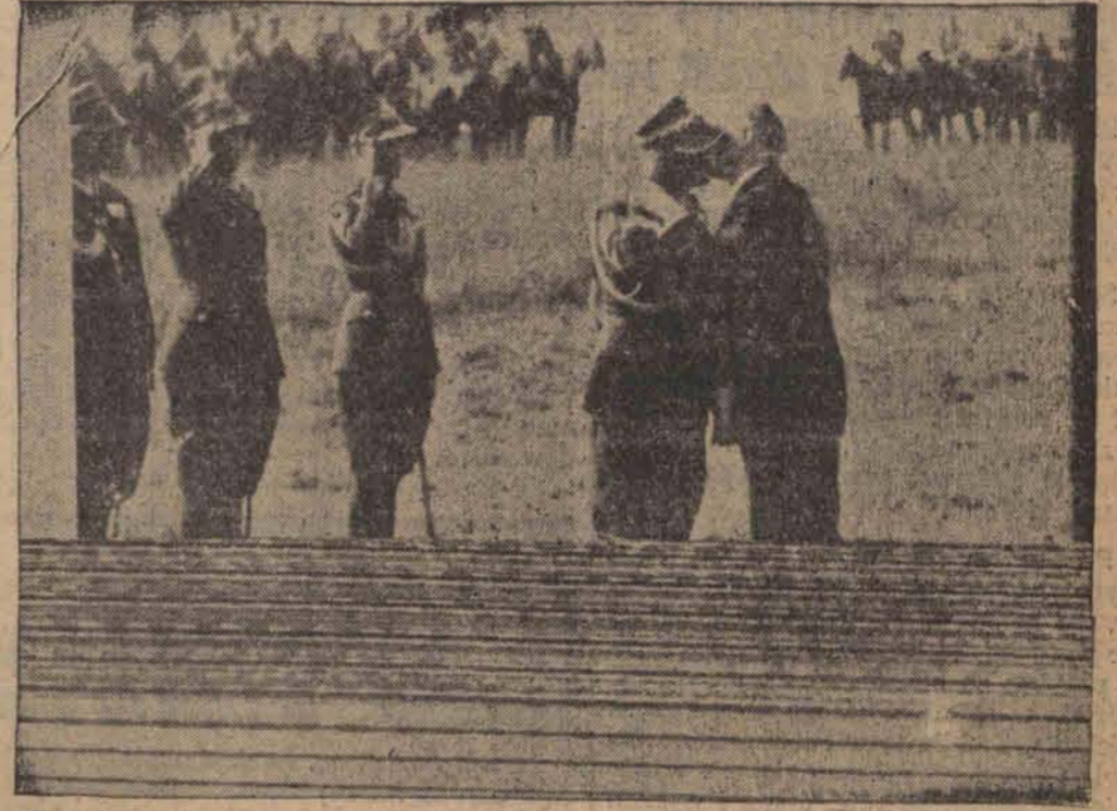
Uroczystość dekoracji Naczelnego Wodza Wojsk Polskich najwyższym odznaczeniem francuskim odbyła się w miejscowości Sulpes, w odległości 26 km. od Chalons sur Marne, na terenach manewrowych, dokąd przybył Prezydent Lebrun w towarzystwie ministra Wojny Daladier. W uroczystości uczestniczył ambasador Łukasiewicz, gen. Gamelin, generał francuski i polski. Prezydent Lebrun z odkrytą głową udał się na środek czworoboku z ustawionych oddziałów kawalerii i piechoty i podszedłszy do gen. Rydza-Śmigłego rzekł: „Generale Rydzu-Śmigły nadaje mi Ci Wielki Krzyż Legii Honorowej”. Po tych słowach, Prezydent Lebrun przez wiesiel przez pierś Generała Wielką Wstęgę z czerwonego jedwabiu, oraz ucałował Generała, zaś wojsko oddało honory. Fototelegram przedstawia moment symbolicznego pocałunku Prezydenta Lebrun, po ceremonii dekoracji.

WIELKI SUKCES POWTAŃCÓW. SEWILLA, 4.9. W codziennym swym przemówieniu radiowym gen. Queipo de Llano oświadczył, iż jest nadal optymistą poczem stwierdził, że wojska powstańcze odniosły wielki sukces w Talavera de la Reina. Nieprzyjacieli wycofał się a oddziały powstańcze wkroczyły do miasta, gdzie znalazło 10 armat i wielką ilość karabinów maszynowych i ręcznych. Wojska powstańcze — mówił generał — znajdują się obecnie w odległości 100 km. od Madrytu. ROZPACZLIWA OBRONA. HNDAYE, 4.9. Korespondent Reutera podaje, że oddziały powstańcze zajmują obecnie część Irunu. Ludność cywilna uciekła z miasta, którego bronią jeszcze nie liczne grupy milicjantów.