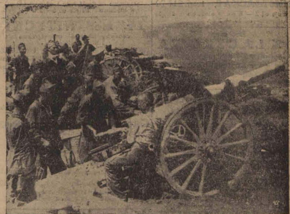
Wojska powstańcze gen. Molla zdobyły leżące na granicy francuskiej miasto Irun, niezwykle ważny punkt strategiczny hiszpańskich wojsk rządowych. Przez zdobycie Irun powstańcy utworzyli sobie drogę do San Sebastian i częściowo zablokowali Madryt. Na zdjęciu bateria wojsk powstańczych ostrzeliwuje przedmieścia San Sebastian.