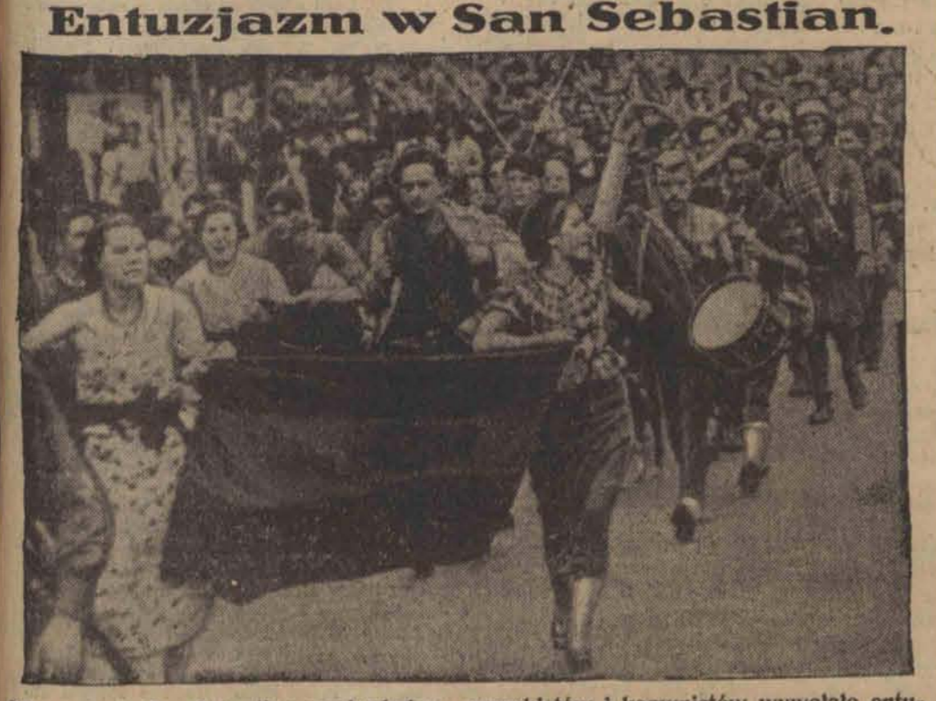
Wyzwolenie San Sebastian spod władzy anarchistów i komunistów wywołało entuzjastyczne manifestacje ludności na cześć wkraczających wojsk powstańczych. Na zdjęciu: kobiety niosą chorągwie narodowe

MADRYT 18.9. Wojska oblegające Alcazar dokonały głębokich podkopów, w których