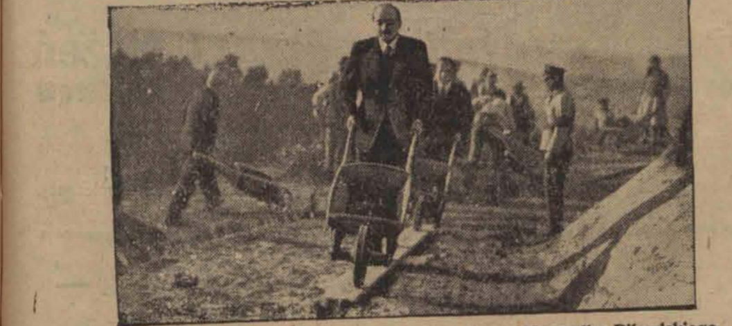
Min. Bastid z symboliczną taczka ziemi na kopcu Marszałka Piłsudskiego.

waż obleżeni dokonywali częstych wypadków, niszcząc rozpoczęte prace. Obie strony przywiązują duże znaczenie do wyniku walk w pobliżu Toledo, które posiada wielkie znaczenie strategiczne. Na froncie Talavera, gdzie zarówno powstańcy, jak i rząd madrycki skoncentrowały swe najlepsze wojsko, nadal trwa walka ze zmiennym powodzeniem.