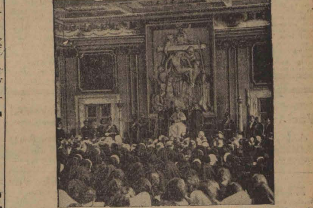
Papież Pius XI wygłosił w Castel Gandolfo przemówienie do 600 Hiszpanów w którym potępił okrucieństwa wojny domowej i podkreślił niebezpieczeństwo bolszewizmu dla świata.