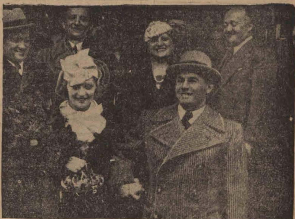
Marta Eggerth i Jan Kiepura opuszczają urząd stanu cywilnego w Katowicach.