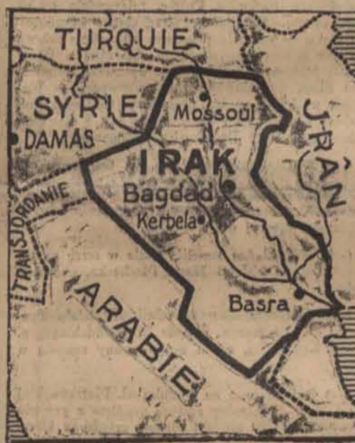
Mapka Iraku, gdzie partia wojskowa dokonała przewrotu i ujęła władzę w swe ręce.