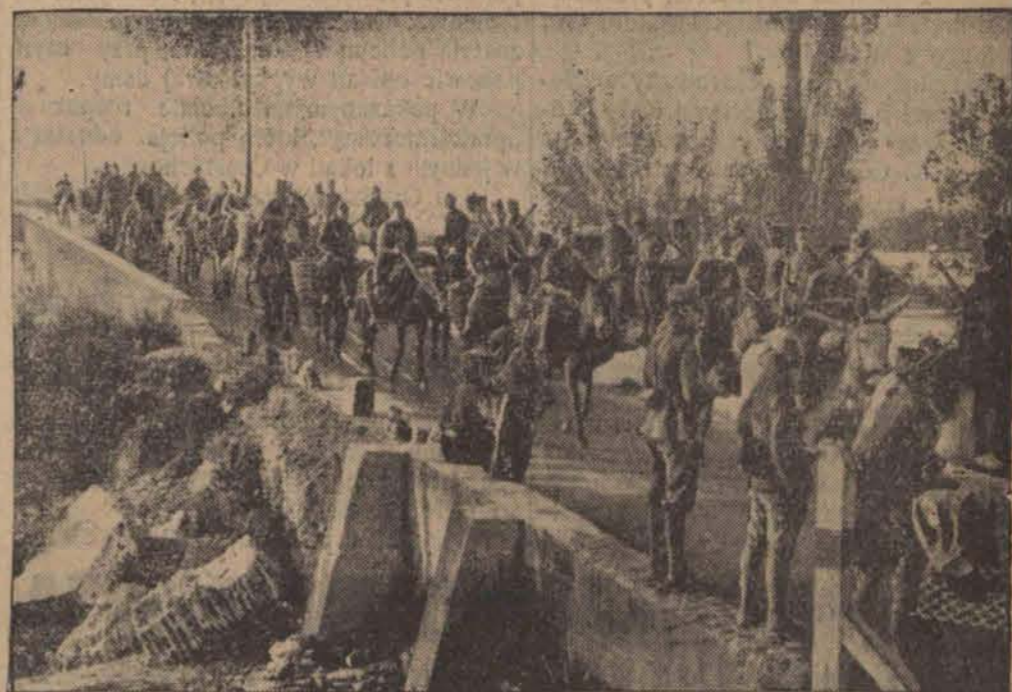
Oddziały powstańców wyruszają z Navalcarnero szosą prowadzącą do Madrytu.