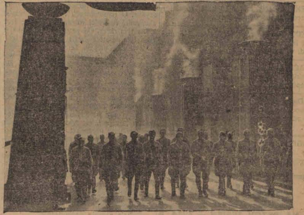
Kanceler Hitler oraz premier Goering w otoczeniu głównych przywódców niemieckiej partii narodowo-socjalistycznej udają się do hali wódzów w Monachium.