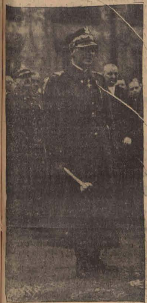
salutuje buławą poczty sztandarowe pułków.

Ta sama rozgłoszenia podaje dalej, że wojska powstańcze posuwają się w dalszym ciągu ku środkowi Madrytu. Na dworcu północnym zabrano wojskom rządowym armate. Zacięta bitwa toczy się w dzielnicy uniwersyteckiej na ulicach Toledo i Las Delicias.