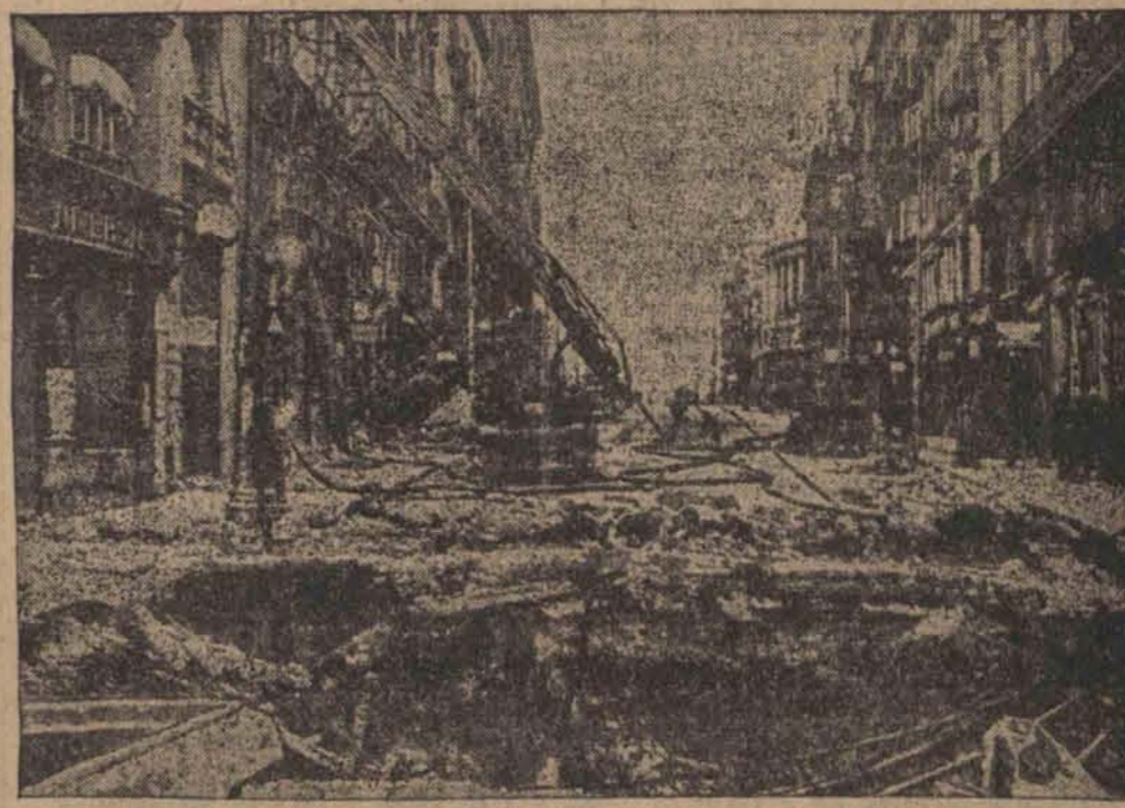
Jedna z głównych ulic Madrytu, obrócona częściowo w gruzy, wskutek akcji bombardowania miasta przez samoloty powstańcze.