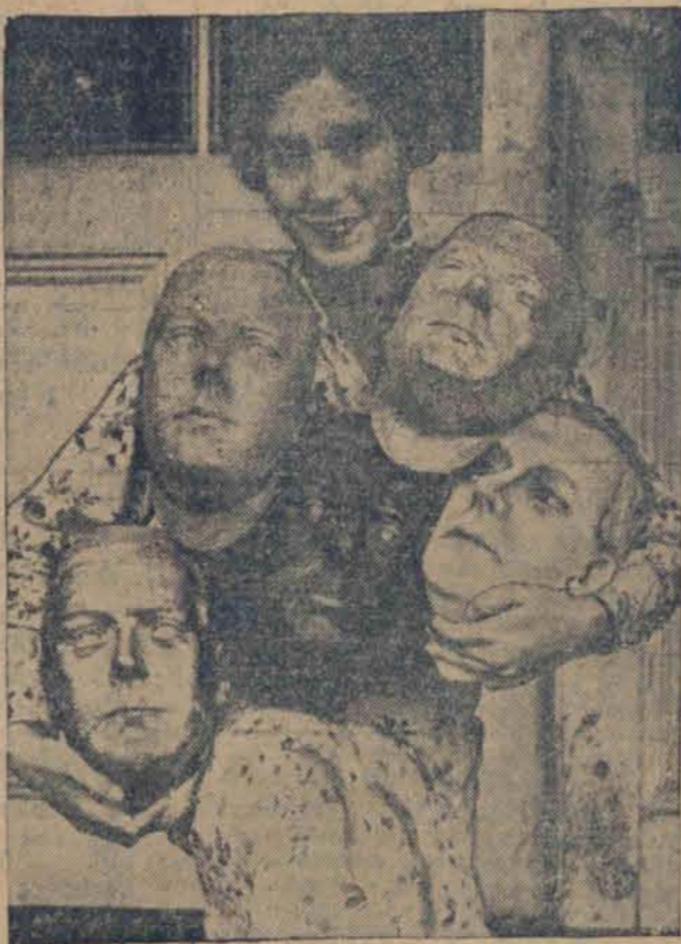
straciły swą wartość z powodu abdykacji króla Edwarda.