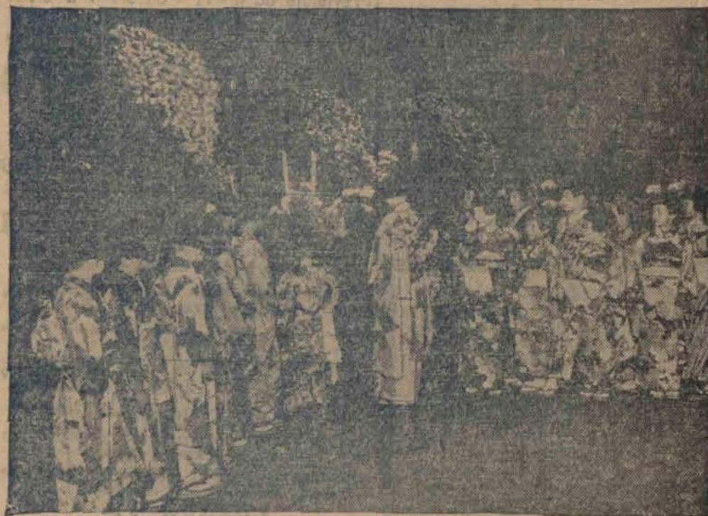
W kwicistych jedwabnych kimono biorą małe Japonki udział w dorocznym „Święcie chryzantem” w tokijskim parku Hibiya.