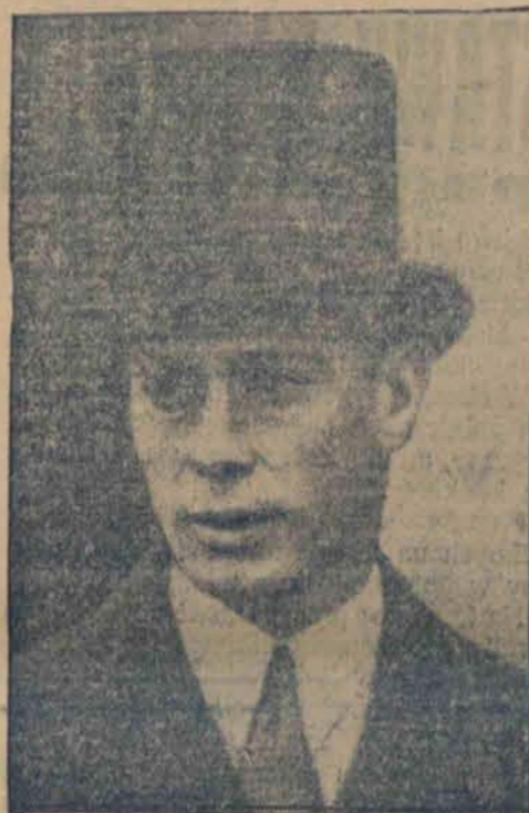
B. król Edward Windsor