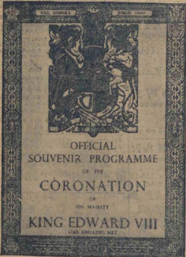
Tylko program koronacji w dniu 12 maja 1937 r. za chowa swą wartość, ale po zmianie imienia Edwarda VIII na Jerzego VI.