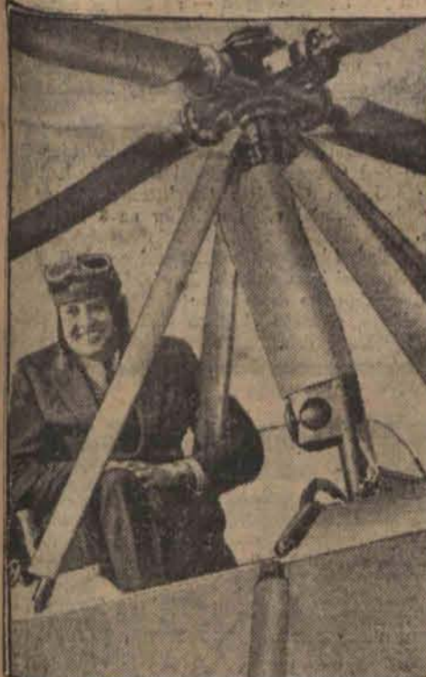
DON JUAN DE LA CIERVA