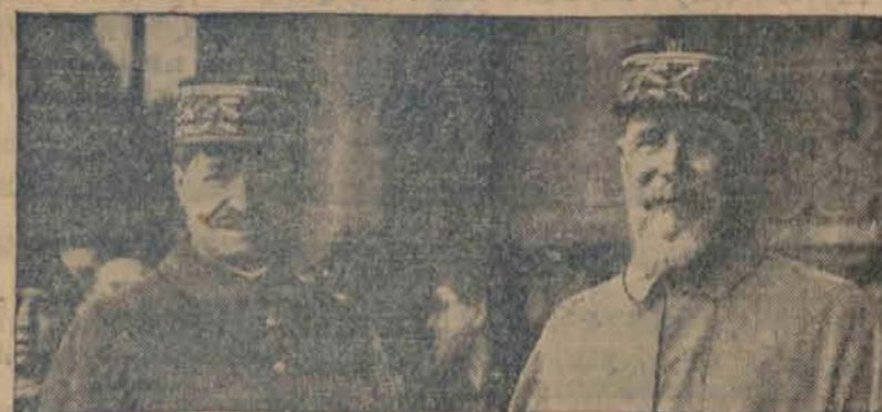
Nowy gubernator wojskowy Paryża gen. Pretelat (na lewo) w towarzystwie dotychczasowego gubernatora gen. Gouraud (bez ręki), który wskutek przekroczenia granicy wieku przechodzi na emeryturę.