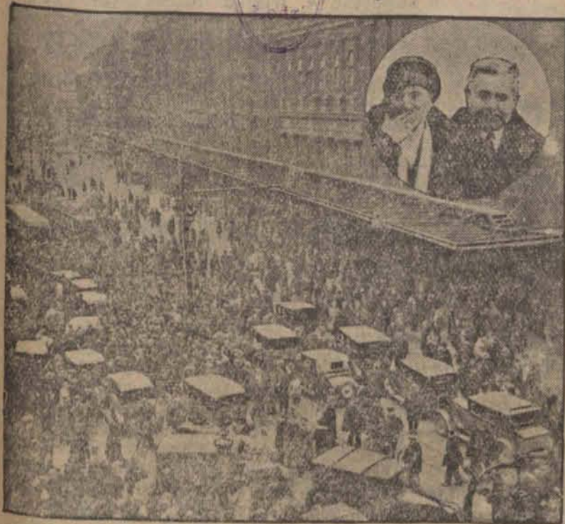
U góry: Emile Daudet, ułaskawiony przez prezydenta republiki przywódca francuskich

royalistów. U dołu: Powracającego z wygnania Daudeta oczekują tłumy przed gmachem dworca w Paryżu. (h)