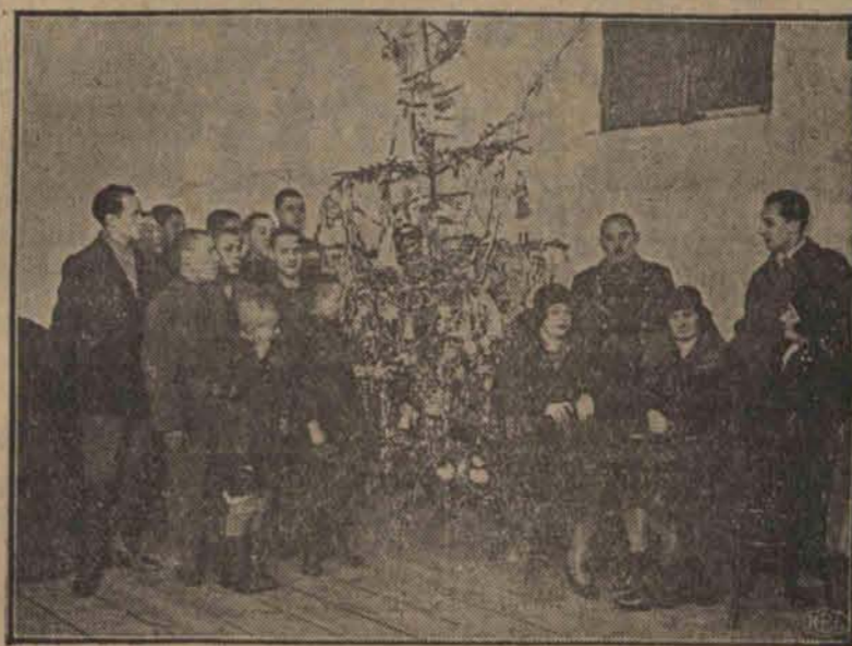
W wzięciu przy ul. Kopernika urządzono choinkę dla nieletnich przestępców. Na zdjęciu po lewej stronie grupa przestępców, a po prawej — opiekunowie.