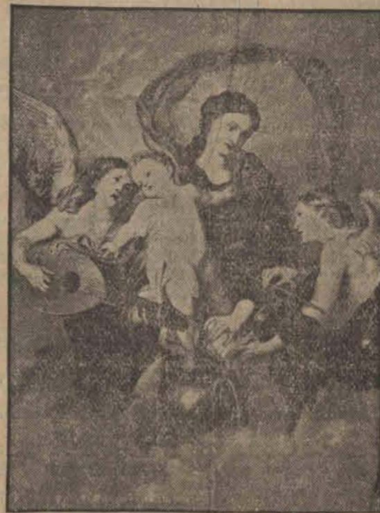
Onegdaj zamieściliśmy ilustrację przedstawiającą ramy w otwartej skrzyni, z której

w niewytłumaczony sposób skradziono słynny obraz Van Dycka: „Koncert amielski” wartości 1 i pół miliona złotych. U góry skradziony obraz (h)