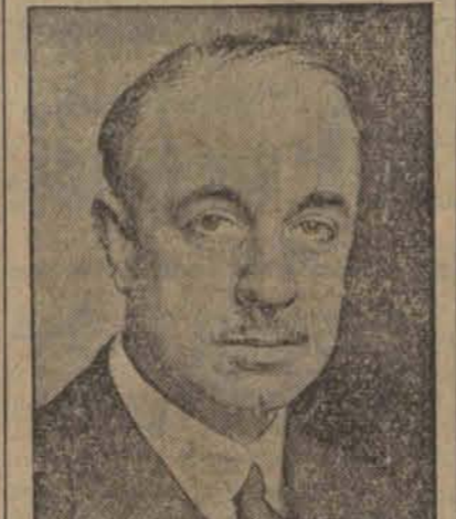
Sir Eric Drummond generalny sekretarz Ligi Narodów, obchodzi dzisiaj dziesięciolecie swego urzędowania na tym wysokim stanowisku.

wyasygnowania wielkich kredytów na odbudowę gospodarstwa, reorganizację fabryk, odnowienie maszyn i zakupy surowców. Sfery rządowe oczekują od tej akcji ożywienia przemysłu i radykalnego zmniejszenia bezrobocia.