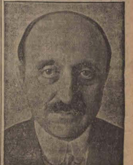
Petręscu-Comnène nowomianowany poseł rumuński w Rzymie jest zwolennikiem ścisłego zbliżenia włosko-rumuńskiego.

w niepowołane ręce. Wina aresztowanych 2 telefonistek nie została jeszcze udowodniona.