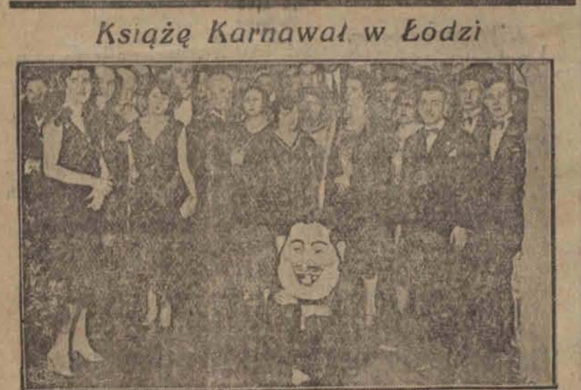
Księżę Karnawał w Łodzi

Tęsamem zostanie podjęte na nowo bezpośrednie połączenie między Polską a Chinami przez Charbin, które było przerwane od czerwca 1929 roku. t. j. od chwili wybuchu zbrojnego konfliktu chińsko-sowieckiego go z powodu kolei wschodnio-chińskiej. Równocześnie zostało wznowione połączenie telegraficzne Moskwy z Charbinem i Pekinem oraz szeregiem innych miast chińskich.