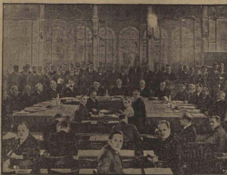
Posiedzenie Rady Ligi Narodów pod przewodnictwem ministra Zaleskiego w Genewie, (h)