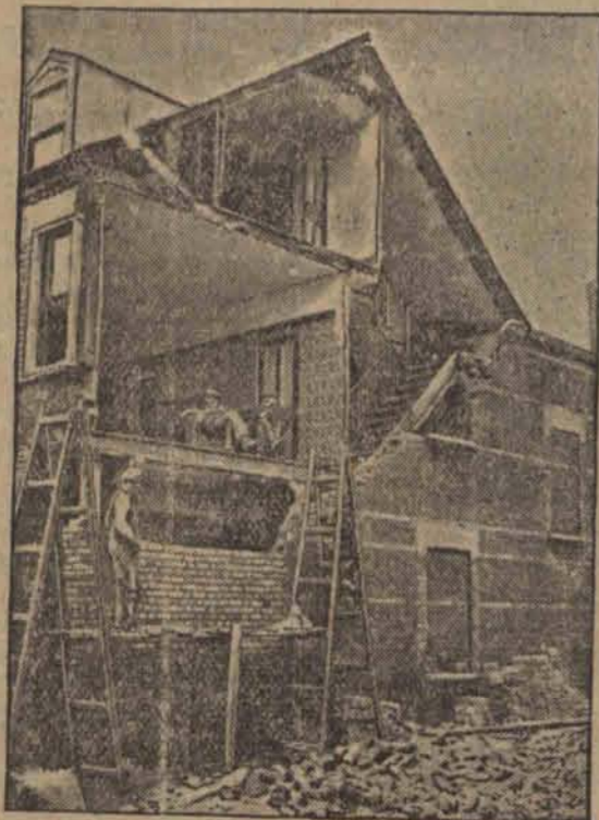
W Londynie ostatni huragan zawałił kilka domów. Pod walcącą się ścianą zginęło dwóch przechodniów.