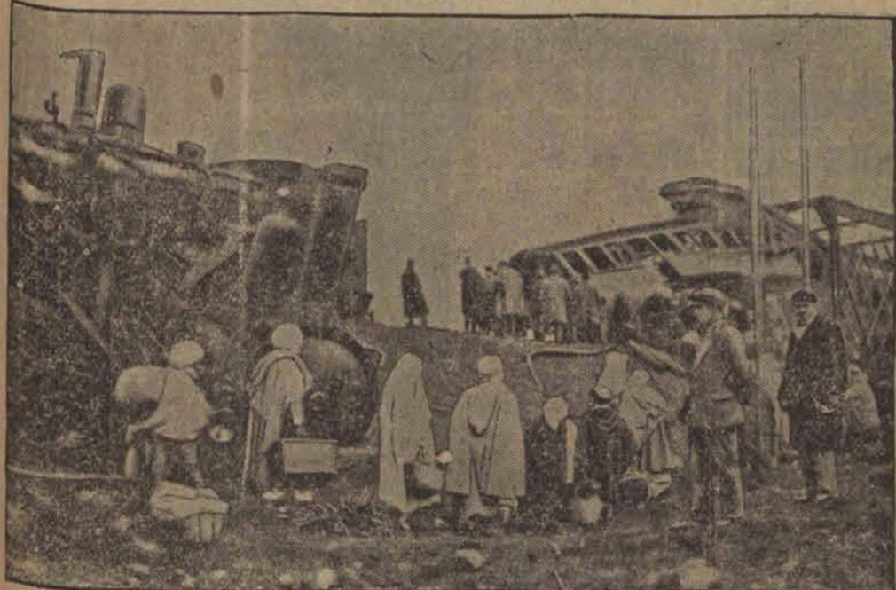
Jak donosiliśmy niedawno, pociąg pospieszny Tunis — Algier padł ofiarą strasznej katastrofy. 20 osób straciło życie, 25 osób uległo śmiertelnym obrażeniom. Na ilustracji miejsce katastrofy przed zawalonym mostem, który stał się przyczyną nieszczęścia. (h)