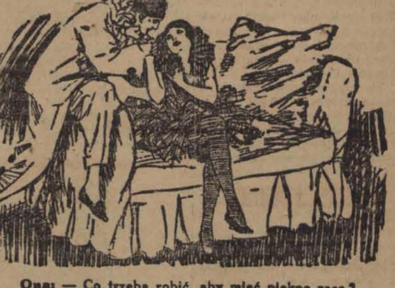
Ona: — Co trzeba robić, aby mieć piękne ręce? On: — Nic, absolutnie nie...