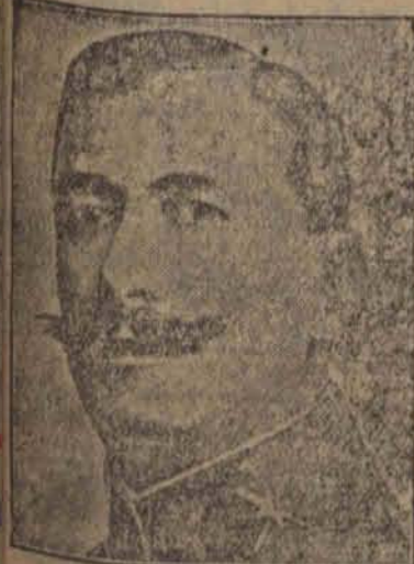
nowy premier Hiszpanji.