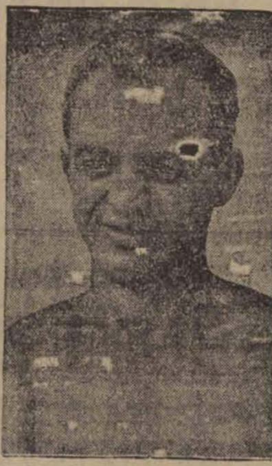
Frankle spotkają się dnia 6 lutego na berlińskim stadionie