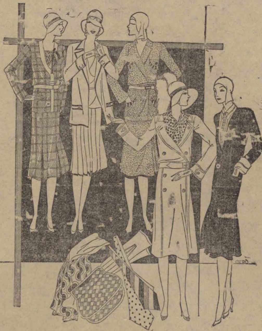
1) Kostiumowa sukienka z tweedu na ulicy. 2) Sukienka z żakietem z ciemnym obszyciem. 3) Bronzowy kostium z tweedu. Oryginalne kieszenie. 4) Zabardyny. 5) Ciemna sukienka na ulicy z welutyny. Pod tem ja sportowy płaszcz wiosenny z jasną bluzeczka sportowa.

Wzorzysty płaszcz podróży z tweedu z dużym kieszeniem. Należy zwrócić uwagę na brak paska.