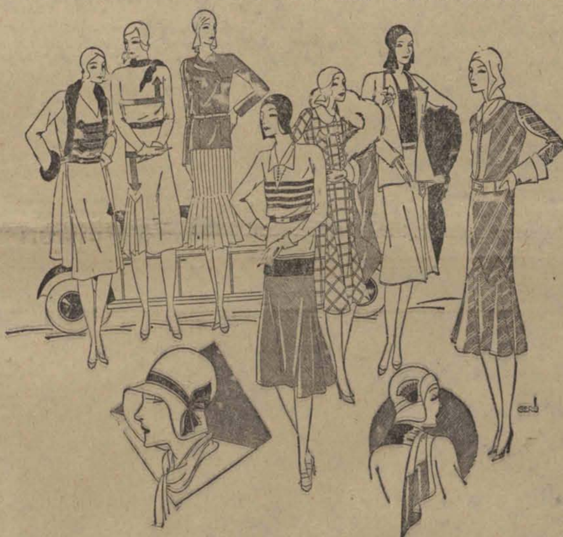
1) Jasno-niebieska sukienka wiosenna z ciemnym obramowaniem i naszytymi bordiurkami. Ostro dekolt. Spódniczka z boczna faldą. 2) Jasna sukienka z tweedu z oryginalną bordiurką. Spódniczka z jednostronnym układem fald. 3) Kompozycja uliczna: ciasna bluzeczka z tweedu, jaśniejsza sukienka z zaszytymi u góry i rozniwoczeniami u dołu faldami. 4) Szykowny dżemper trykotowy z ciemnymi poprzecznymi paskami, do tego zwykła spódniczka kostiumowa. 5) Sukienka z tweedu w duże kratki; spódniczka z przodu gładka, z boku duże dzwony. 6) Jasny komplet wiosenny z luźnym żakietem ciemna bluzeczka jedwabna. 7) Sukienka z tweedu z oryginalnymi naszywkami jedwabnymi i dużymi mankietami. Spódniczka dzwoneczkowa; pasek skórzany. 8 i 9) Jasne wiosenne kapelusze filcowe.

Po prawej: Jasny impregnowany płaszcz z peleryną do odpinania. Szeroki pas skórzany.