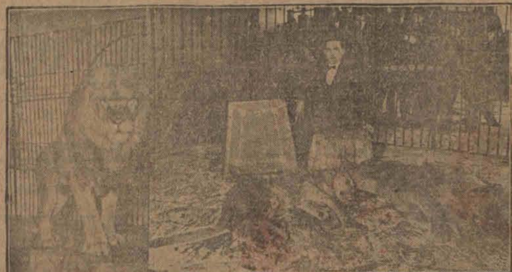
Dwa zabite lwy (Opis na stronie drugiej.)