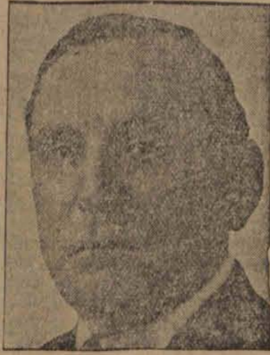
P. Moore, pierwszy ambasador amerykański przy rządzie polskim zmarł w Kalifornii na zapalenie płuc.

Warszawa, 18. 2. (Od wł. k.) S. p. Aleksander Moore był jednym z najwybitniejszych postaci amerykańskiego świata politycznego. Dzięki wielkim zdolnościom i niezwyklej pracowitości zdołał on zrobić zawrotną karierę życiową.