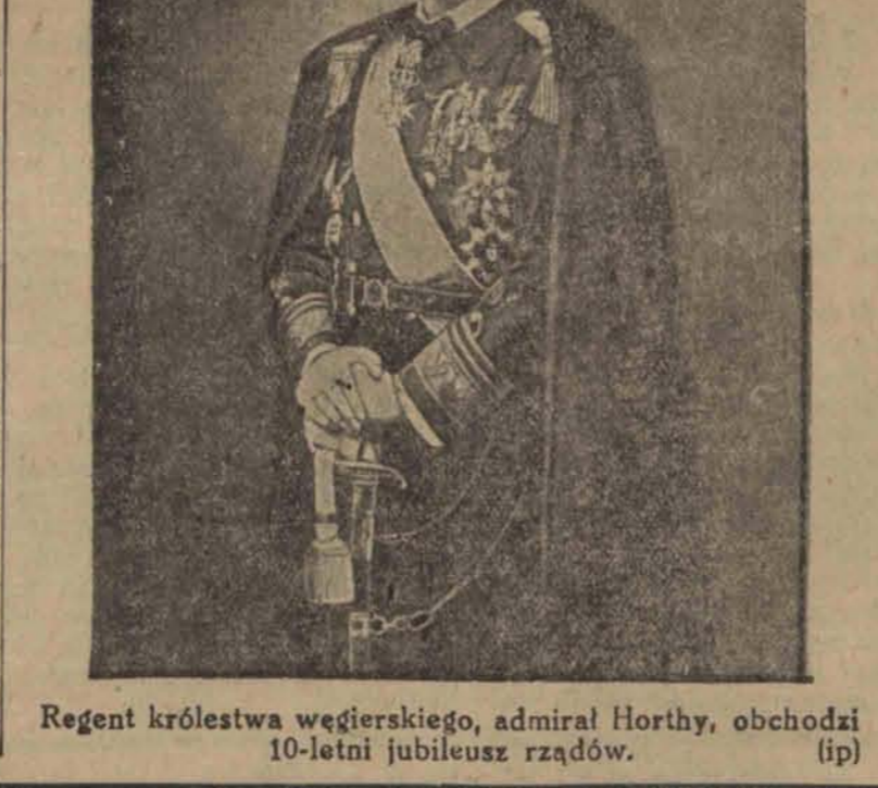
Regent królestwa węgierskiego, admirał Horthy, obchodzi 10-letni jubileusz rządów.

Od stołów dolatywały rozmowy wulgarnie i brudne jak ściek uliczny. W kącie spełnili na prowizorycznym podjum, umieszczono muzykę składającą się z harmonji, skrzypiec i basów.