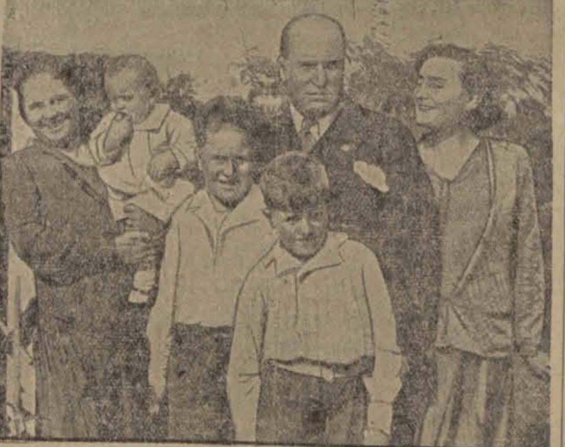
Rodzina dyktatora Włoch. Po prawej stronie córka Edda o której zaręczynach donieśliśmy przed kilku dniami (ip)