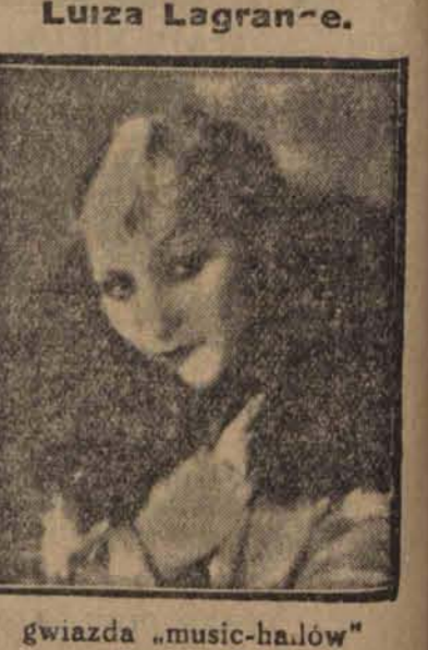
gwiazda „music-halów” paryskich.

tów artyzmu. W grobowcach egipskich znajdują się naczynta i pięknej emalji, której długość trwałość jest do dziś jeszcze tajemnicą. Po rozbiciu monarchii egipskiej przez wojska perskie sztuka ta poszła w zapomnienie. W Europie do XIII wieku używano naczynt niepolerowanych i dopiero podczas wojen krzyżowych garncarze europejscy zdobyli od swych kolegów ze Wschodu tajemnicę emaljowania wypalanej gliny.