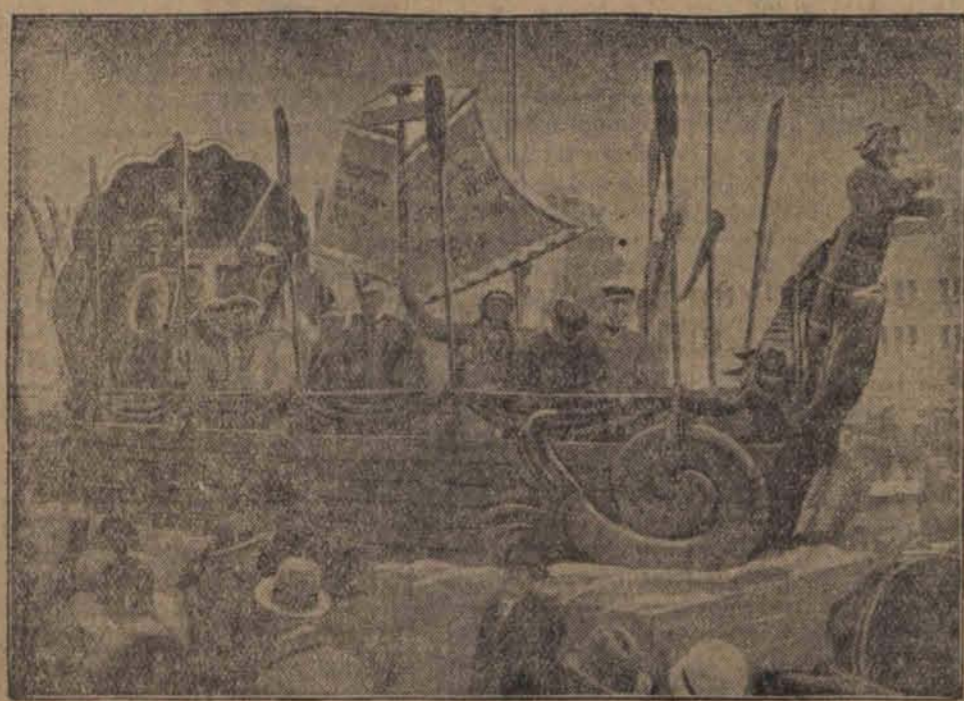
Obok Nicej również Kolonja scena z wesołego pochodu ulicznego. (w) „osrodka karnawałowego”. Na ilustracji