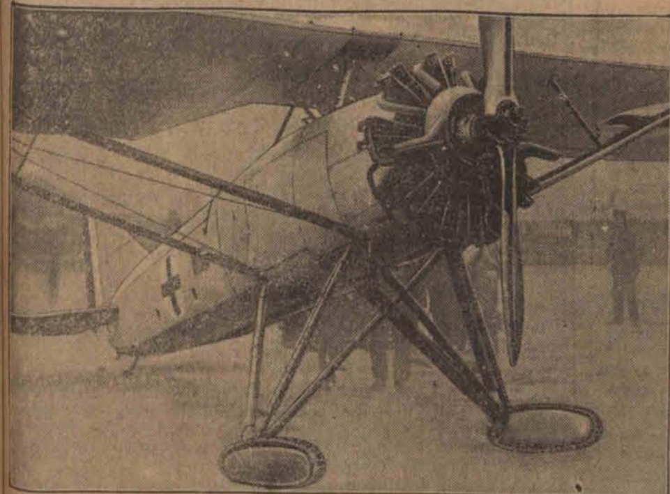
We Francji wypróbowano umożliwiający lądowanie na pierwszy samolot zaopatrzonego nierównym terenie zamiast kół w ślimacze płozy. (w)