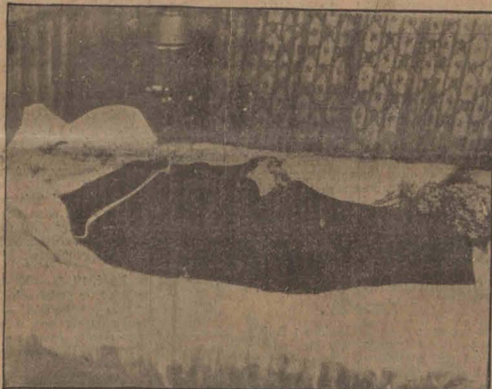
Zwłoki Primo de Rivery o zdane w habit przed włożeniem do trumny. (h)

w Belwederze. O godzinie 1-ej po południu z przed domu Nr. 25 w Alei Ujazdowskiej wyruszył pochód młodzieży szkół powszechnych do Belwederu.