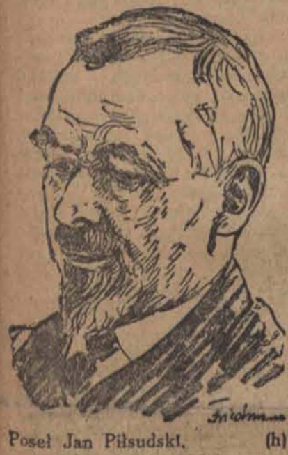
Posel Jan Piłsudski. (h)

Odzina 10-ta. Warszawa, 29 marca. — (Od wł. kor.) Nad ulicą Wiejską od wczoraj zawisły ciężkie chmury. Dzisiejszy dzień 29 marca uważany jest za dzień niezwykły.