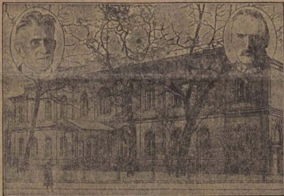
Gmach Sejmu przy ulicy Wiejskiej.