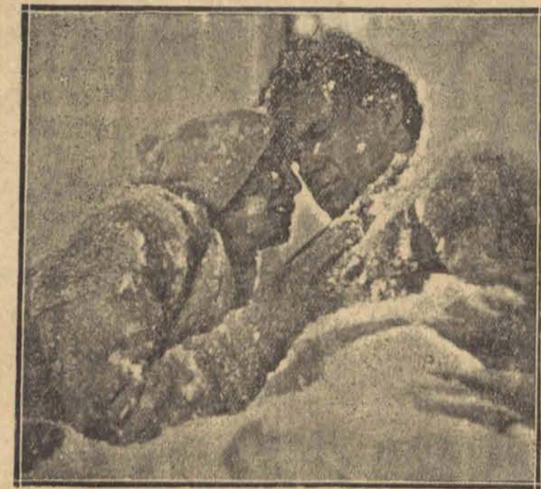
Gustaw Diers i Leni Riefenstahl w obrazie „Białe pieśń”.