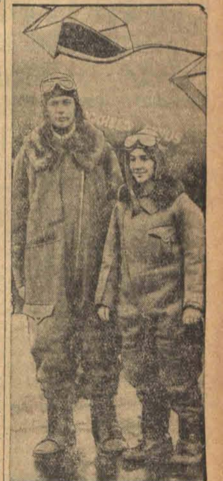
Pułkownik Lindbergh, pierwszy pogromca Atlantyku ustanowił wraz ze swoją żoną nowy rekord światowy, przelatując odległość 4.300 km. z Los Angeles do Nowego Jorku w ciągu 14 godzin 45 minut. Lindbergh leciał na wysokości 5000 metrów z szybkością 280 kilometrów na godzinę. (h)