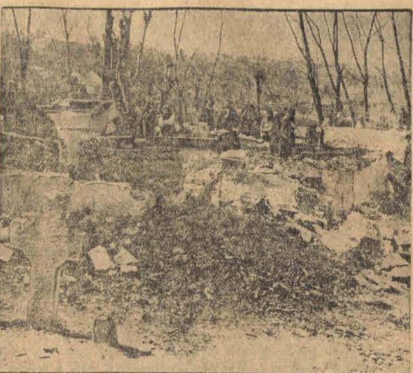
Fundamenty spalonego drewnianego kościoła wiejskiego w Costești (Rumunia) gdzie 110 osób spłonęło żywcem. (H)