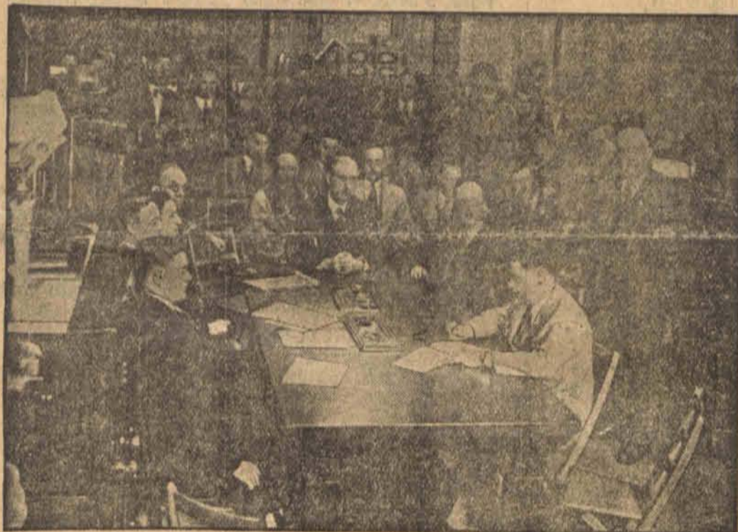
Gubernator stanu Columbus przesłuchuje kluczników więzienia, o którym z powodu odmowy otwarcia bram podczas pożaru spłonęło żywcem 318 więźniów. (h)