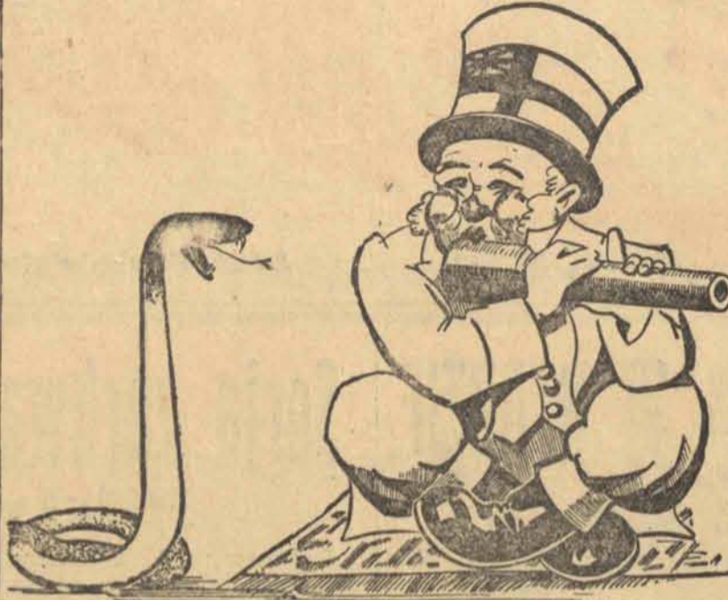
John Bull (Wielka Brytania) przyciąga na fujarce, aby uspokoić indyjskiego węży (ruch rewolucyjny).