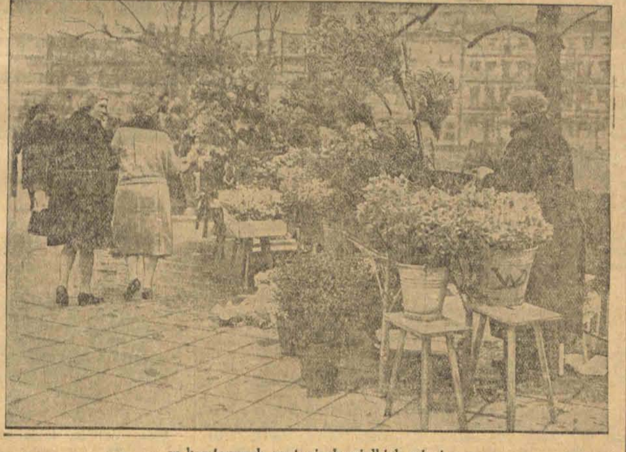
w kamiennych pustyniach wielkich miast.