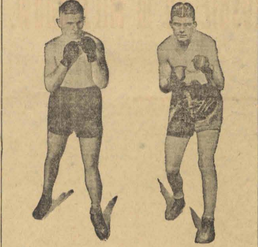
SENSACYJNE SPOTKANIE BOKSERSKIE.