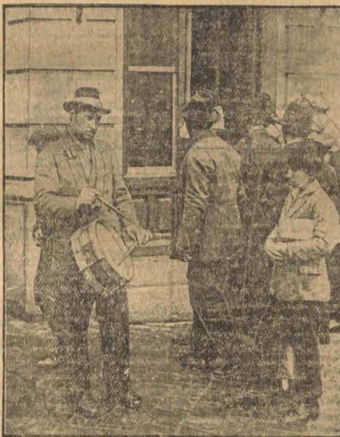
Z opornymi płatnikami podatków obchodzą się w Rumunji bezwzględnie. Sekwestrator bebnem zwoluje mieszkańców i w krótkiej drodze sprzedaje zajęte rzeczy. (ip)