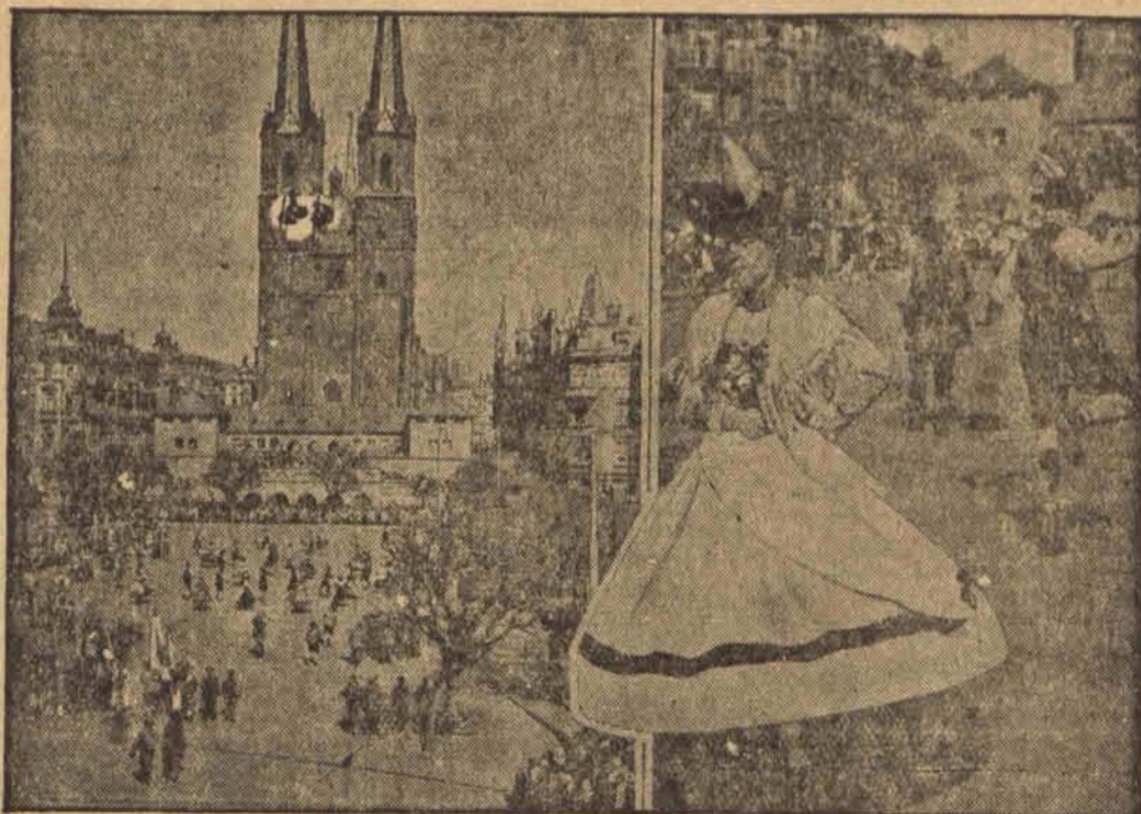
Jak wiadomo odbywa się w drugim dniu Zielonych Świątek doroczny zjazd do salin wielkich, połączony z zabawami ludowymi w podziemiach. Podobny zwyczaj utrzymał się również w salinach w Halle, gdzie jednak górnicy produkują się starymi tańcami na starożytnym rynku. Po lewej stronie: Zabawa na rynku w Halle. Po prawej: tańcząca para. (h)