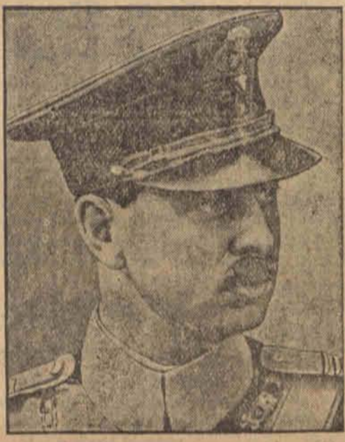
Karol II nowy król Rumunii.