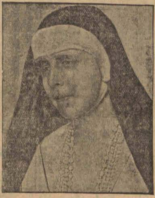
Królowa Marja matka króla Karola.

Stolica Rumunii, podobnie jak cały kraj, stoi pod wrażeniem powrotu ks. Karola. Dotąd panuje wszędzie spokój i porządek, a nie brak objawów zadowolenia i radości. Stolica kraju przybrała szatę odświęt-