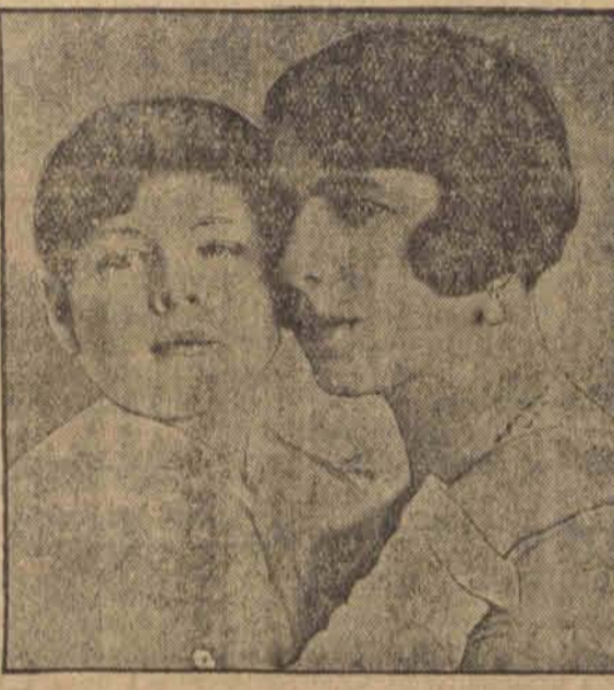
Książę Michał ze swoją matką księżną Helena