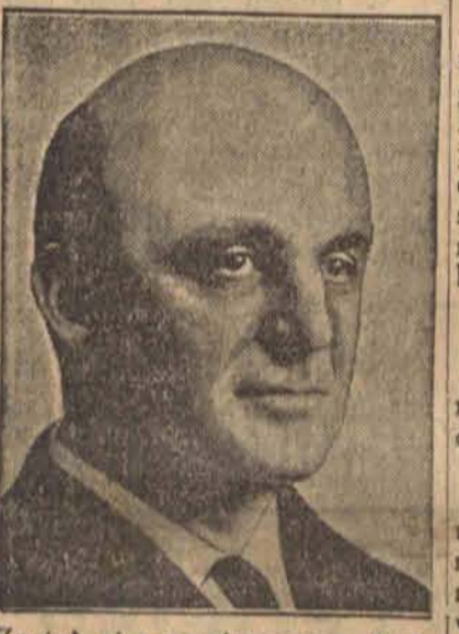
Został nim zamianowany były gubernator Filipin Carmeron Forbes, wnuczek amerykańskiego poety-filozofa Emersona.