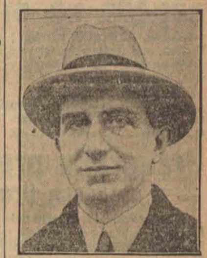
Parker Gilbert agent reparacyjny w swem sprawozdaniu końcowym ostro skrytykował niemiecką politykę finansową.

Bukareszt, 17. 4. (Od wł. k.) Polski minister pełnomocny hr. Szembek złożył wizytę ministrowi spraw zagranicznych p. Mironescu, aby w imieniu Prezydenta Rzeczypospolitej i rządu polskiego złożyć życzenia królowi Karolowi II z powodu wstąpienia na tron.