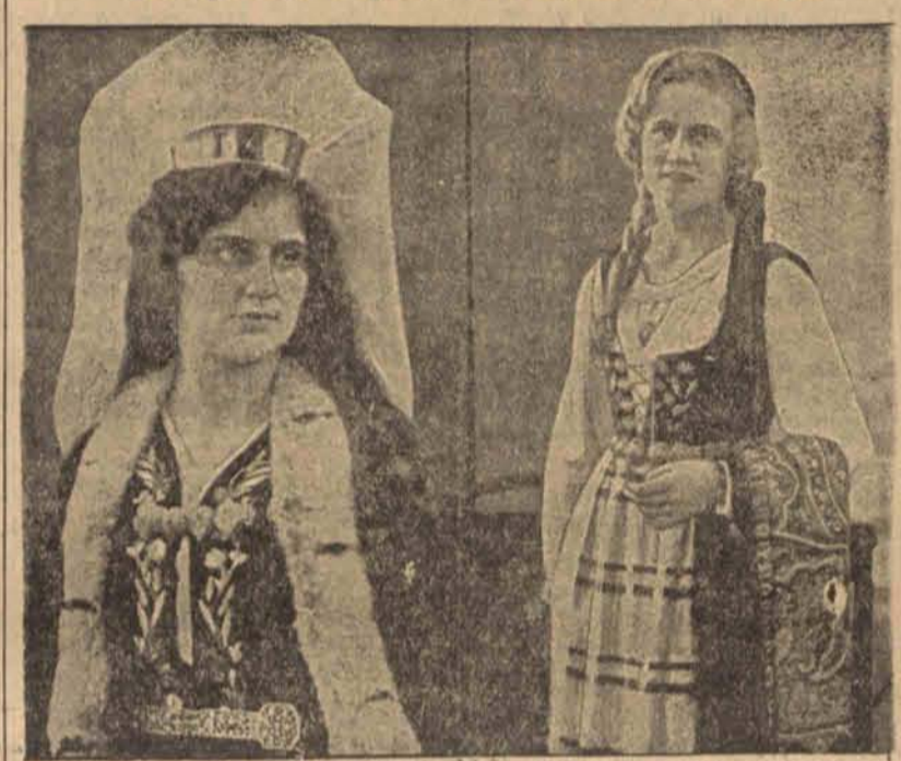
Typowe przedstawicielki pić pięknej na Islandji. Z prawej strony widzimy pannę młodą w stroju ślubnym...