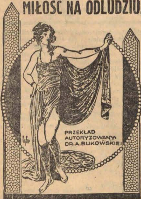
PRZEKLAD AUTORYZOWANY DR. A. BUKOWSKIEJ