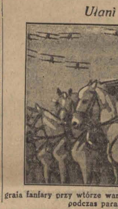
Ulani polscy grający fanfary przy wtorze warkotu motorów aeroplanów...