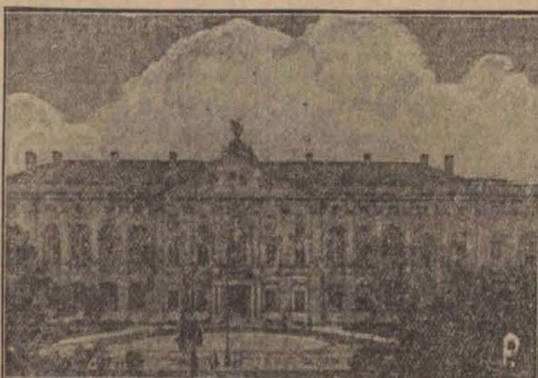
gdzie mieści się Sąd Najwyższy.