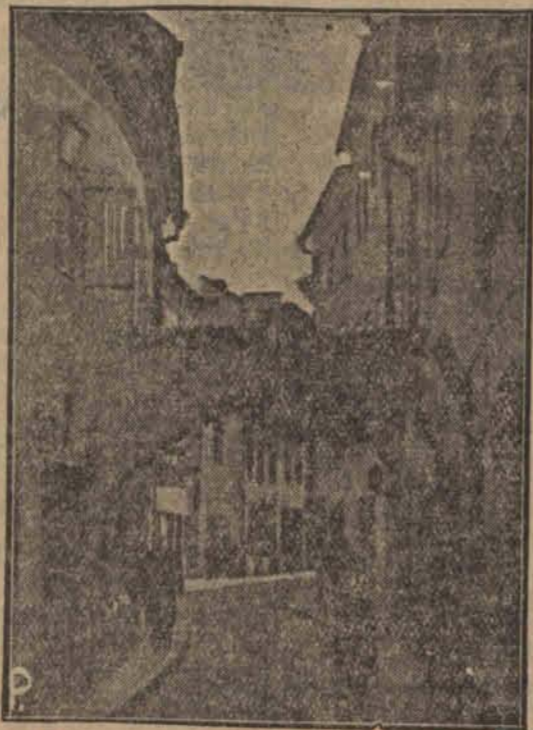
Jeden z zaułków ghetta żydowskiego.