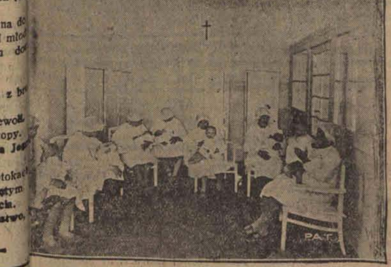
Zdjęcie fragment karmienia dzieci przez matki robotnicze w czasie przerwy obiadowej w Tytoniowego. Na

Moskwa, 15. 7. (Od wł. kor.) Rozszono tu uchwały ostatniego kongresu komunistycznego wbrew smutnym doświadczeniom ostatniego roku przewidywanego planu. 1) Przeprowadzenie pięciu lat czterech; 2) Zwiększenie kolektywizacji rolnictwa; 3) Zwiększenie likwidacji prywatnych przedsiębiorstw. W ciągu najbliższego roku na kolektywizację rolnictwa przeznaczono miliard rubli papierowych. Do końca bieżącego roku kolektywizacja ma pochłonąć pół miljarde rubli papierowych, które, jak wiadomo według ostatniego kursu czerwońca na giełdach światowych odpowiadają zaledwie czwartej części rubla złotego.