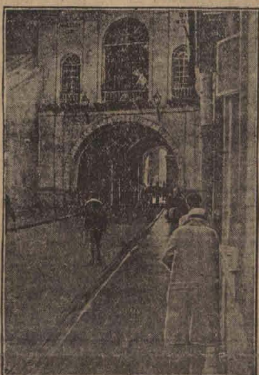
Ostra Brama w Wilnie.