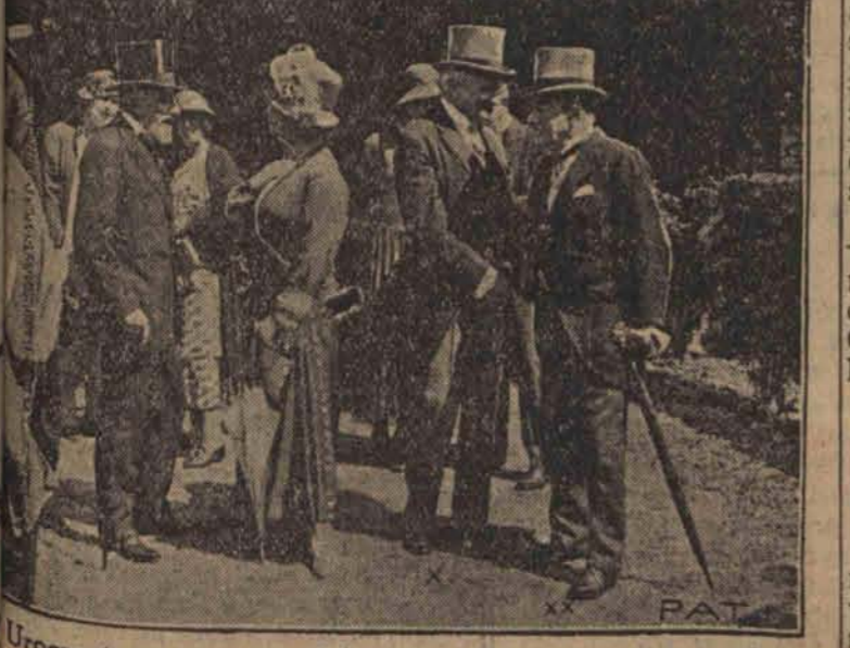
Uroczystego otwarcia dokonał premier angielski Baldwin w obecności ambasadora Francji p. de Fleuriot