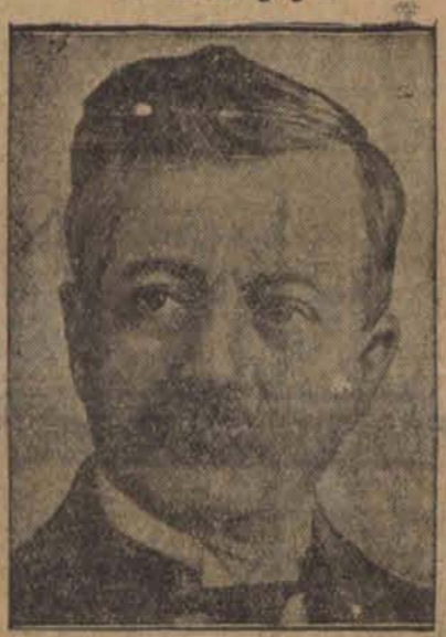
João Pessoa, prezydent brazylijskiego stanu Parahyba, wysunięty na stanowisko wiceprezydenta Brazylii, został przez swego przeciwnika zastrzelony na ulicy.