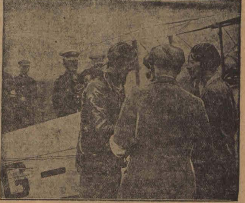
Angielska lotniczka lady Bally na lotnisku w Warszawie, „Moht” w ciągu 1 godz. i 55 m. po przebyciu trasy Poznań —