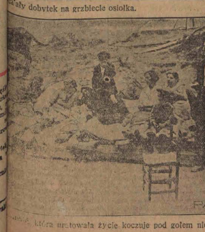
Wielki... zna... nadzieja... zhanek... oczach... rzeka... Golgota... odurzy... Ochota... dwójnie... żądziec... miłość... andomier... ość... na zons... ak Mont... yscy do... zyssta... stan... 351... 15 41... 01... szczęści... zywiz... anych... óra om... dano... pastern... człow... ez psa... meczarn... utkowa... która uratowała życie koczując pod gołębim niebem.