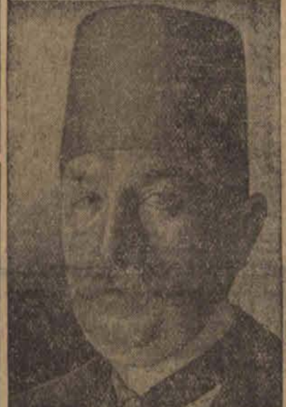
Abbas II Hilmi, b. wicekról Egiptu, zdetronizowany w czasie wojny światowej przez Anglików za okazywane Turkom sympatie — zgłosił swe pretensje do tronu egipskiego, spodziewając się ustąpienia Fuada. (w)