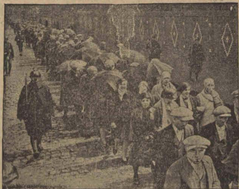
Długo szereg robotników włókienniczych w drodze do „głody pracy” w Halluin. (H)