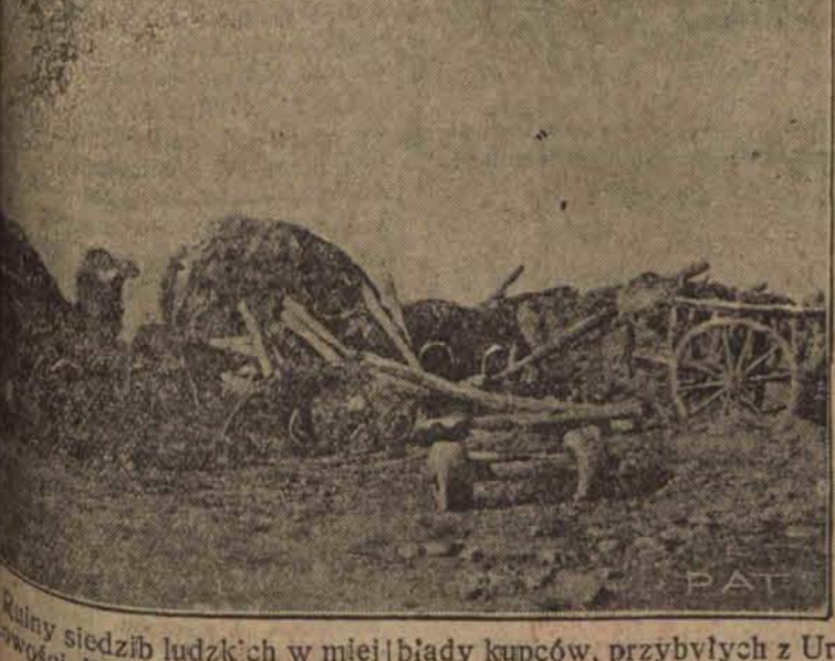
Wielki wstrząs w mieście Dylman, obok wielkiej katastrofy.