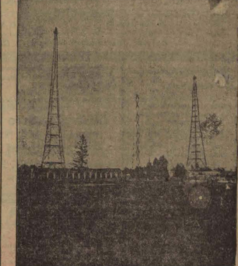
Nowowzniesiona wielka radiostacja antenowa we Lwowie.