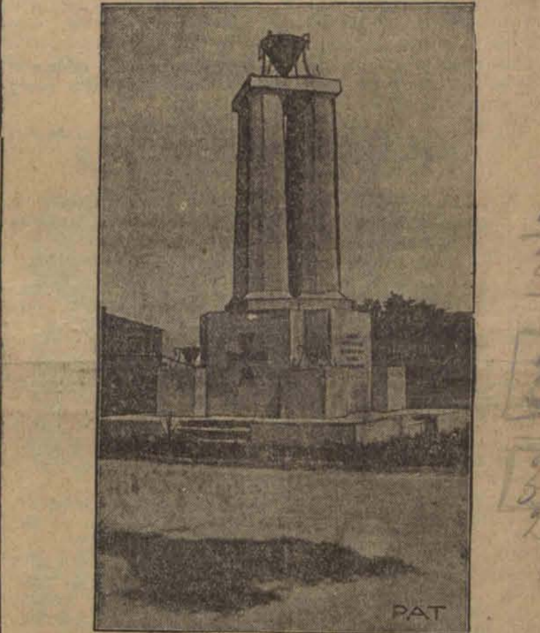
Pomnik ku czci poległych oficerów i żołnierzy 82 p. p. w Brześciu n/B.