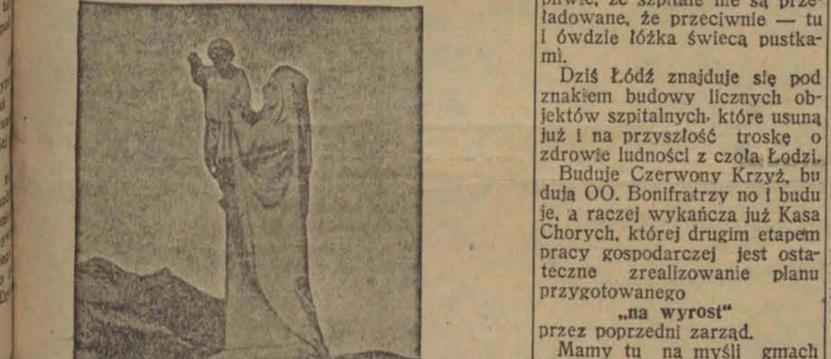
W pobliżu Lourdes została poświęcona olbrzymia statua Matki Boskiej wzniesiona na wysokiej górze. (w)