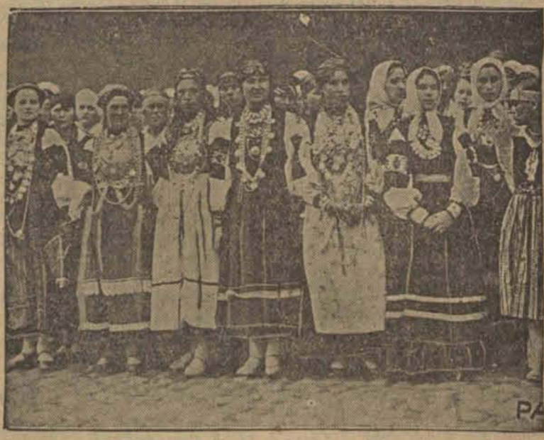
zebrane w Tallinie podczas wizyty p. Prezydenta Rzplitej.