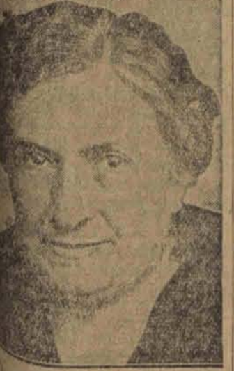
Maria Montessori, światowej sławy twórczyni nowych metod nauczania dzieci — obchodzi 60-tą rocznicę urodzin.