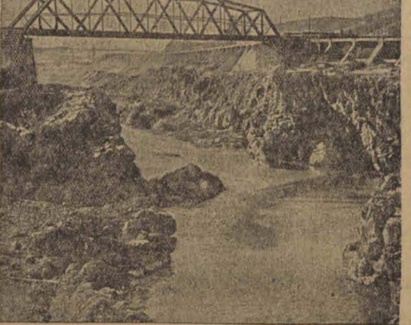
Nad rzeką Jordan wybudowano olbrzymią tamę dla śpiętrzenia wód, które będą uruchamiały turbiny wodne, wytwarzające energię elektryczną dla całej Palestyny. Rzekę skierowano w nowe koryto. (ip)