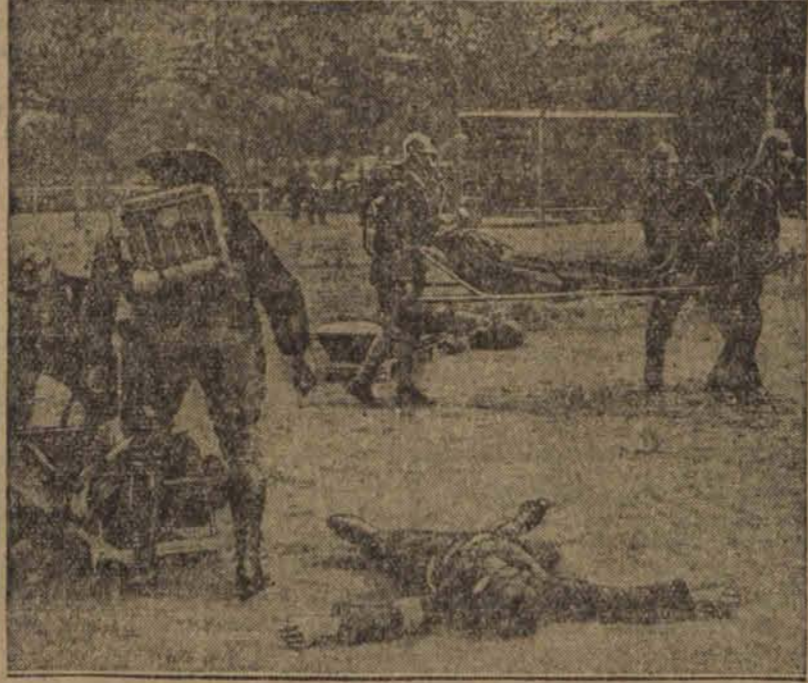
W miastach niemieckich zorganizowano w ub. tygodniu ćwiczenia obrony przeciwgazowej i kursy dla ludności cywilnej.